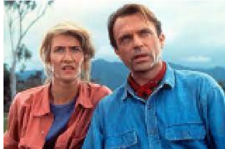
2. Preocupado/a , tratando de entender el enunciado...