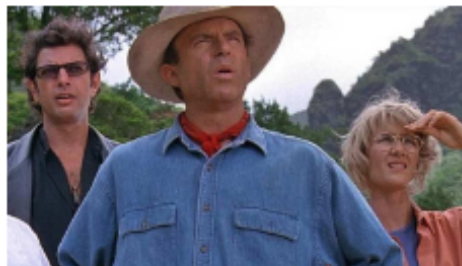
4. Perdido/a ¿Qué consignas?