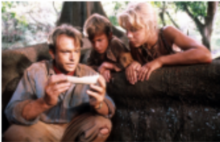
1. Entendiendo todo.

¿Cómo te identificás con la comprensión de consignas?