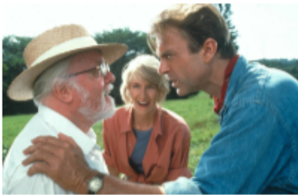
3. Preguntando a todos que hay que hacer, cómo responder.