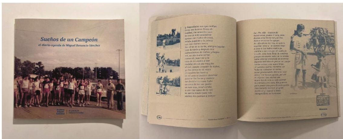
Tapa de Sueños de un Campeón , páginas E16 a y E16 b.