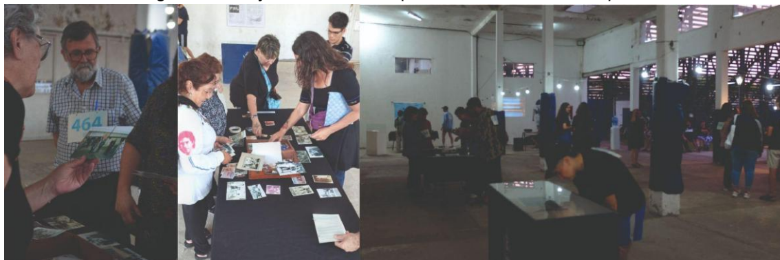
Muestra del Archivo Miguel Sánchez: mesa de facsímiles de fotografías y vitrinas con originales.