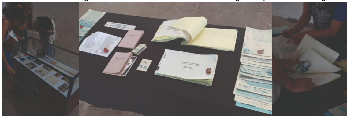
Vitrina con originales y mesa con elementos del proceso de impresión del libro.