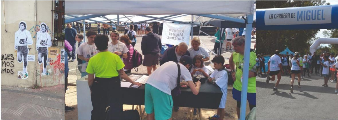
Pegatina y stand del Archivo Miguel Sánchez en La carrera de Miguel en el Bosque de La Plata, 18 de septiembre de 2022.