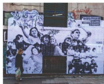
Figura 3: Noche de los lápices. Junto a la Comisión por la Memoria del BBA. Collage con fotos de estudiantes del Bachillerato de Bellas Artes y fotos de archivo de estudiantes desaparecidos. 16/09/2019