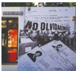
Figura 2: Pegatina de collage digital producido a partir de la restitución de legajos de docentes “cesanteados” del Liceo Víctor Mercante. Marzo del 2019.