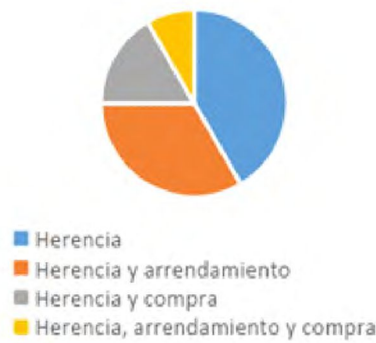
Figura N°2: formas de acceso a la tierra de las familias entrevistadas