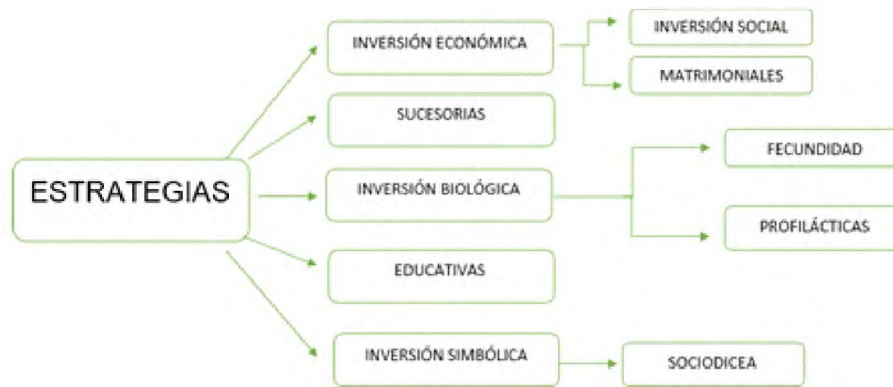
Figura N°: 1. Tipos de estrategias de acuerdo a Bourdieu