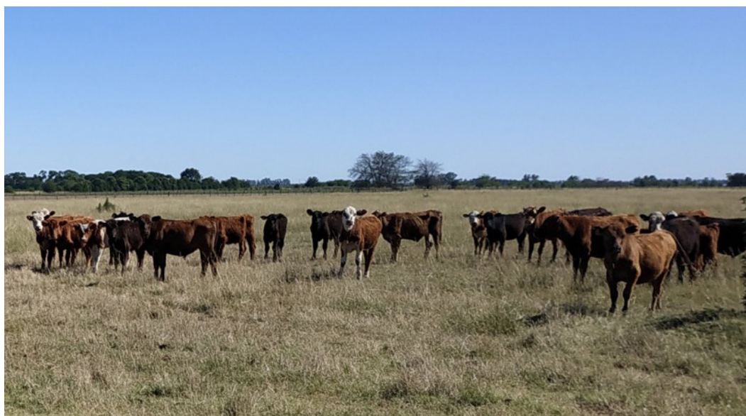
Figura 1. Animales de uno de los lotes afectados (potrero de descanso de pastura natural). Se observa la mala condición corporal del conjunto.

Ante la sospecha de resistencia antihelmíntica, se diseñó y ejecutó un test de reducción del conteo de huevos 11,12 para evaluar la eficacia de las drogas disponibles. Para su realización, en función de los recuentos de HPG, se seleccionaron 30 animales con HPG cercano al promedio