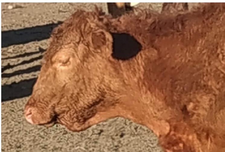
Figura 2. Edema submandibular de uno de los animales más afectados.

Los signos clínicos y las lesiones observadas fueron similares en ambos animales estudiados. Se observó una baja condición corporal (score 1,5/5) y signos evidentes de diarrea (región perineal y cola con abundante materia fecal). A la necropsia se observó la presencia de edema generalizado (submandibular, mucosa del cuajo, intestino, mesenterio), ascitis e hidropericardio. Esta descripción de edema submandibular y diarrea era evidente en otros animales (vivos) de los diferentes lotes (Figura 2).