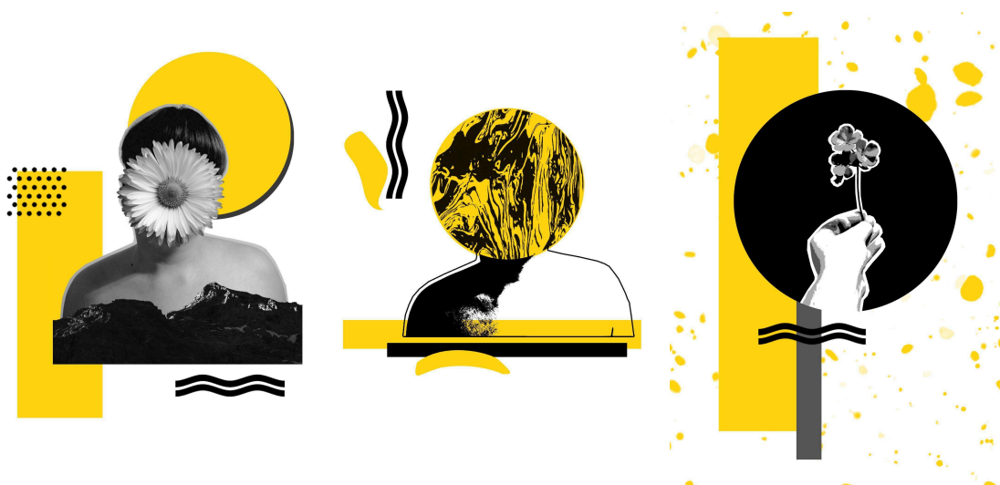
Figura 3. Imágenes extraídas de la página web “Marchitarse y florecer” (2020). Recuperadas de https://macarenabertrand.wixsite.com/mbart