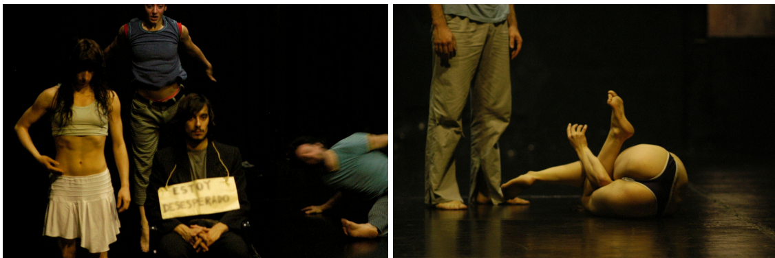
Figura 2. Szeinblum, Diana. Fotografías de la performance “Alaska” (2007).