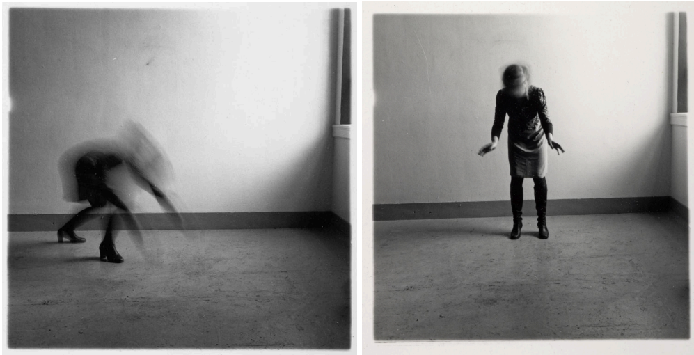
Figura 1. Woodman, Francesca. Imágenes de la serie de fotografías “Espacio” (1975-1978).