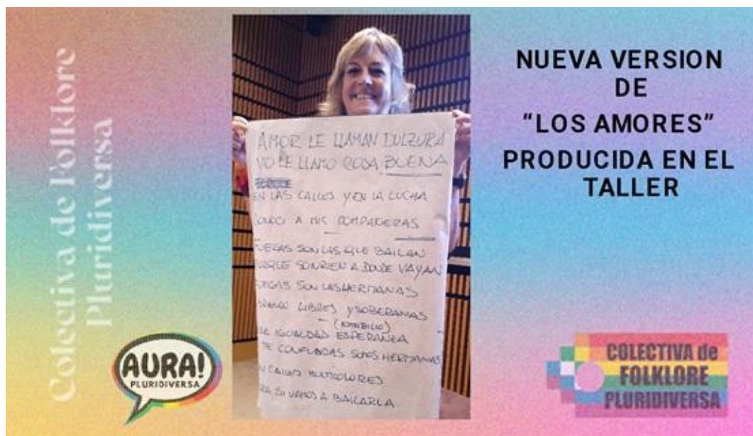
Figura B: Reconstrucción de las letras de Los Amores, Taller en el marco del 8 de Marzo, bajo la consigna “Nosotras movemos el mundo, por la igualdad”, Centro Cultural Kirchner, marzo 2022.

En la actualidad, la complejidad de lo social nos obliga a desarrollar policompetencias tanto en el terreno de lo teórico-conceptual, como desde lo procedimental y actitudinal. En diversos trabajos ya hemos desarrollado este tema 114 y nuevamente volvemos a apostar a experiencias de formación profesional donde pensamiento, emoción, sentimientos, actitudes y destrezas técnicas estén necesariamente integradas. La noción de “pedagogía de la presencia” pretende dar cuenta de la experiencia en la cual el sujeto (que aprende) produce su propia presencia en el proceso de aprendizaje.