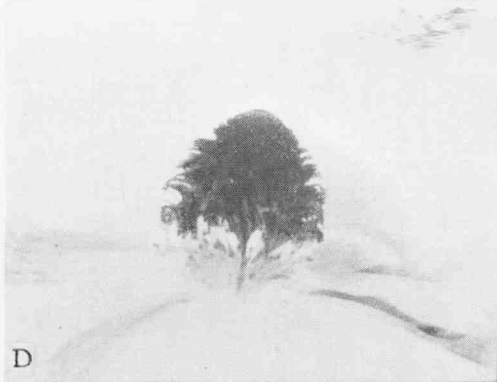
A, flor de una planta normal de Ranunculus asiaticus ; B, flor de una planta « andro-estéril » con anteras rudimentarias abortadas ; C, detalle de las anteras de una flor normal ; D, idem de una planta « andro-estéril ».