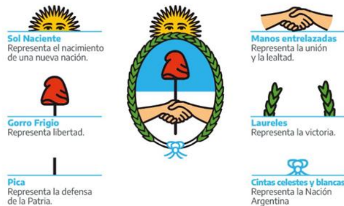
Imagen 1: Escudo Nacional Argentino