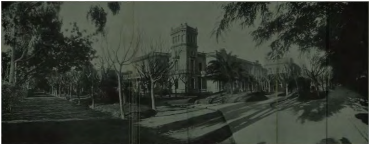
FACULTAD DE CIENCIAS FÍSICO-MATEMÁTICAS. — Frente principal del edificio (al fondo el edificio de los Institutos de enseñanza secundaria)

Figura 5: Fotografías de edificios de la Universidad La Plata. 1926.