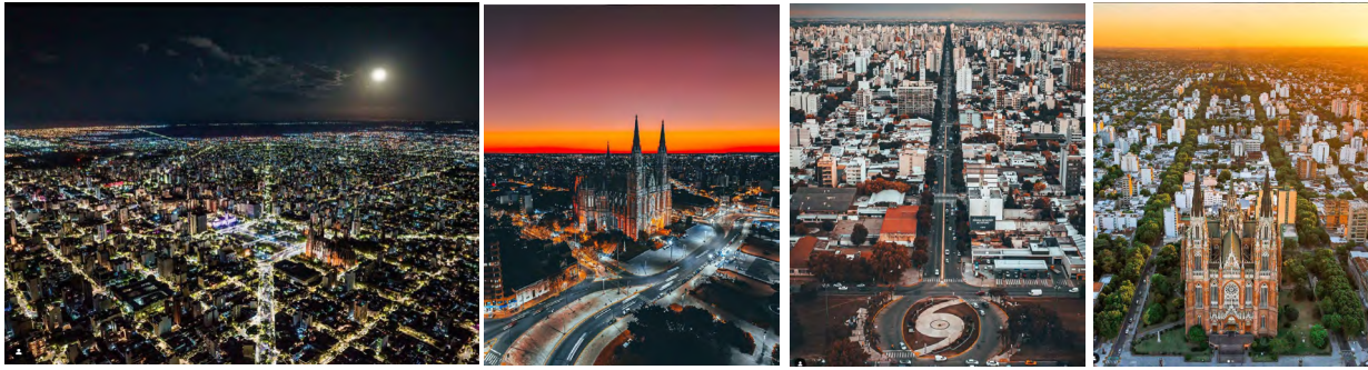
Figura 12: Imágenes capturadas mediante drone de la ciudad de La Plata.