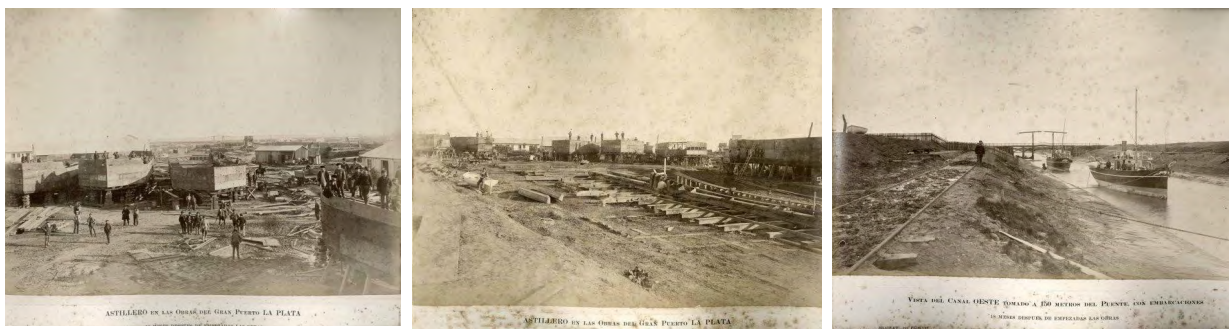
Figura 4: Fotografías fundacionales de la ciudad de La Plata. Paisajes industriales.

La crisis económica de 1890 estancó el crecimiento de la ciudad y, consecuentemente, su registro.