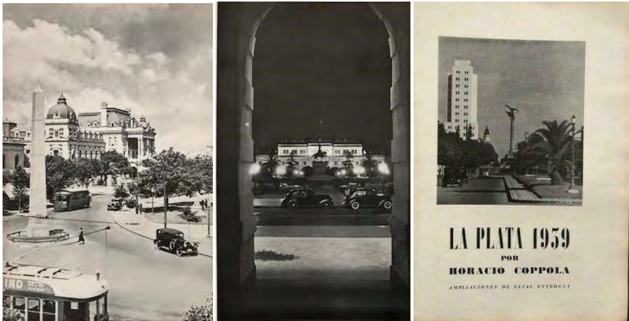
Figura 7: Fotografías a medio siglo de la ciudad de La Plata. Autor: Horacio Coppola. Fuente: "La Plata a su fundador"

a poner en relación los diversos elementos con que el tiempo ha construido la ciudad (Gandolfi, 2004). Edificios fundacionales reconocibles por la iluminación artificial nocturna, construcciones nuevas contrastando con las fundacionales, el paso de los transeúntes, el tránsito de coches modernos, tranvías y colectivos.