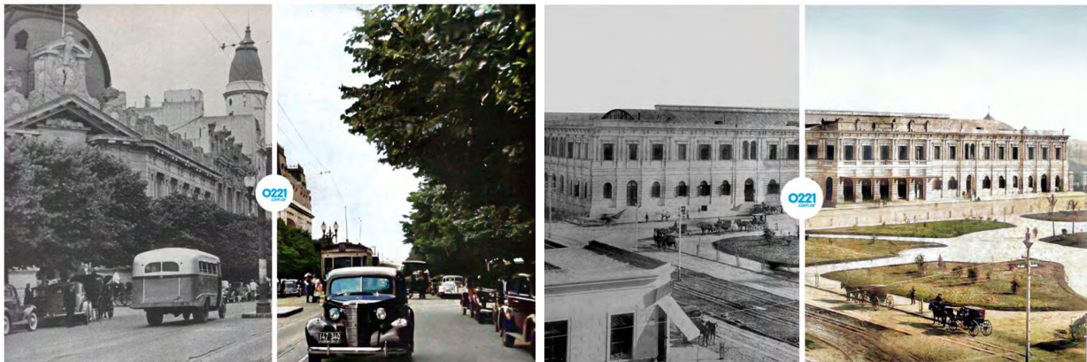
Figura 11: Fotografías históricas a color mediante inteligencia artificial.

Hoy en día, las nuevas tecnologías de inteligencia artificial permiten la utilización de programas que desarrollan sistemas de coloración de imágenes, logrando transformar a color piezas fotográficas históricas reproducidas en blanco y negro. Es así como, en 2020, un medio periodístico platense, seleccionó para tal fin una serie de veinte fotografías que abarcan un periodo de 138 años, ilustrando y difundiendo masivamente el paisaje urbano histórico.