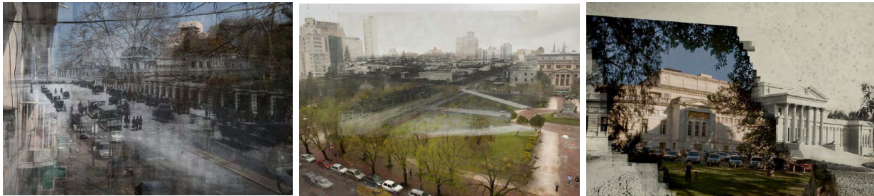
Figura 9: Intervenciones sobre la obra de Bradley. Autor: Hernán G. Rojas.

El uso de las herramientas digitales para su obra no resulta menor o ingenuo. Las mismas posibilitan la incorporación de recursos interactivos donde el espectador tiene la oportunidad de explorar y descubrir el contraste entre lo antiguo y lo actual de un modo participativo que colabora en fijar la experiencia en su memoria. Las calles o los medios de transporte históricos se desvanecen en el pasado mientras que aparecen realidades complejas de la vida presente que generan contraste y tensión, analizando a la vez el modo en que cada uno percibe el tiempo. De este modo construye una narrativa visual que desencadena a la comunidad un momento de reflexión.