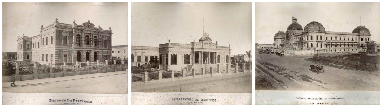
Figura 1: Fotografías fundacionales de la ciudad de La Plata. Paisajes urbanos: edificios públicos.

Cabe destacar que la normativa fundacional tenía como objetivo, entre otras cuestiones, el fin de evitar una ciudad jardín. Es por ello que, en el decreto del 4 de noviembre de 1882 se preveía que las viviendas se construyeran sobre la línea municipal siendo los "edificios importantes" los únicos con permiso para romper esa norma. Situación que se puede comprobar en las fotografías tomadas por Bradley. En la Figura 1 se identifican los edificios públicos retirados de la línea municipal, mientras que, en la Figura 2, las construcciones de viviendas y comercios se posicionan sobre la misma, a modo de telón de fondo.