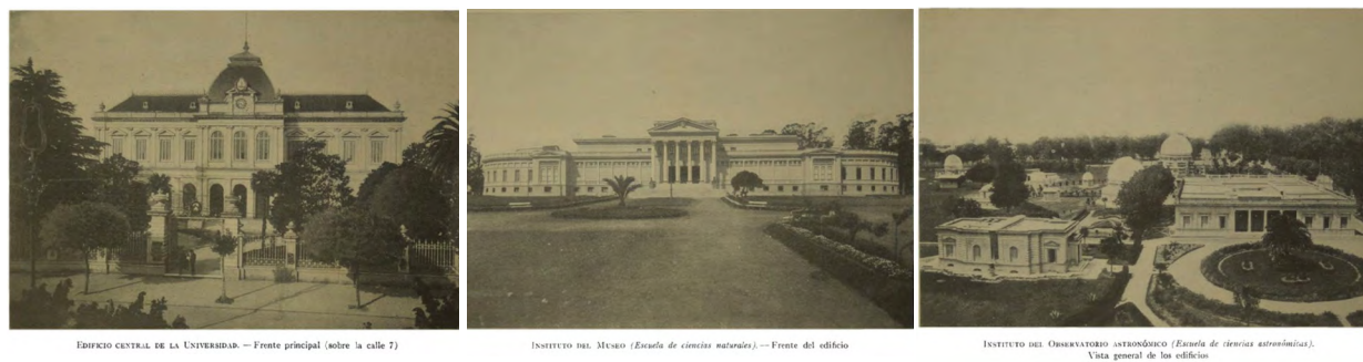
EDIFICIO CENTRAL DE LA UNIVERSIDAD. — Frente principal (sobre la calle 7)

La fundación de la Universidad Nacional La Plata en 1905 fue el emprendimiento significativo edilicio de mayor envergadura post fundación. Por lo que se produjo, nuevamente, un fenómeno de búsqueda de publicidad a través de imágenes fotográficas que volvían a mostrar un acelerado proceso de construcción que involucraba a un conjunto de edificios de inspiración clásica que causaban un gran impacto y que a pesar de formar una pequeña ciudad en sí misma, se integraban al conjunto de palacios públicos fundacionales (Gandolfi, 2004). Cabe destacar la publicación "La universidad de La Plata en 1926" en la que se encuentran numerosas fotografías de edificios de la casa de estudios, brindando valiosa información sobre el paisaje urbano de la época (Figura 5).