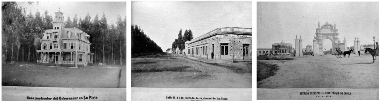
Figura 3: Fotografías fundacionales de la ciudad de La Plata. Paisajes urbanos: el Bosque.