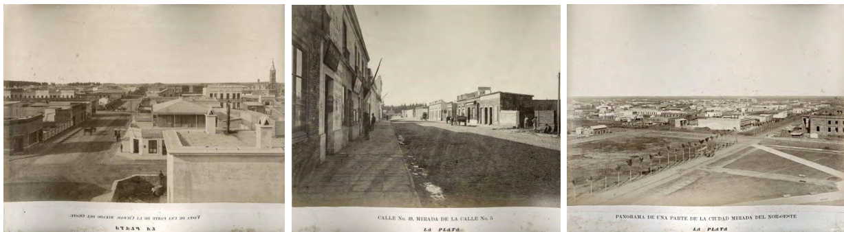
Figura 2: Fotografías fundacionales de la ciudad de La Plata. Paisajes urbanos: vivienda y comercio.

Como se mencionó anteriormente, dentro del casco urbano de la ciudad se encuentra el Bosque, espacio público verde destinado al esparcimiento y cultura. La visión fundacional higienista, estética y contemplativa decimonónica se puede verificar en las fotografías de Bradley (Figura 3). Es así como el verde, aparentemente natural, contrasta con las construcciones. Constituyéndose como un paisaje bucólico, en el que está inserta la arquitectura ecléctica palaciega.