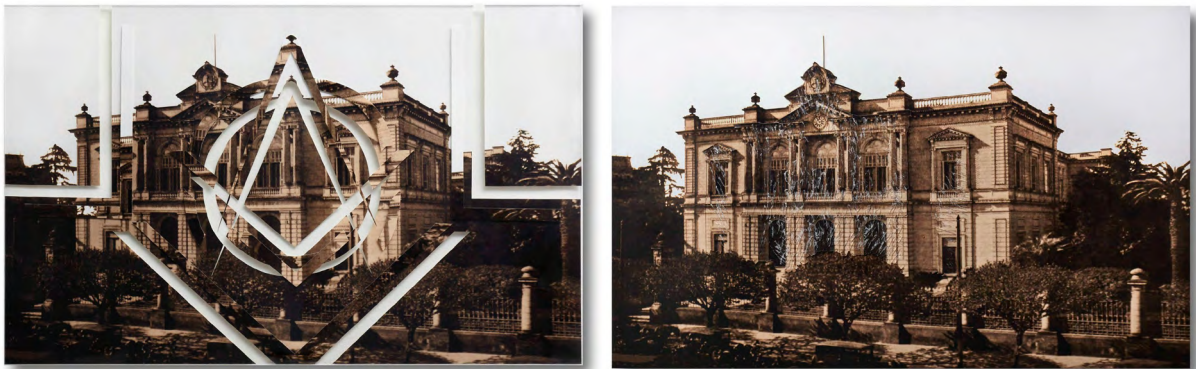
Figura 8: Intervención sobre fotografía histórica del Banco Provincia. Fuente: "La casa simbólica". Autora: Paula Toto Blake.

Particularmente, realiza dos tipos de operaciones: por un lado cala fotografías y planos realizados al momento de la fundación, generando un juego de llenos y vacíos que aluden a una geometría masónica pero que al mismo tiempo desafían la firmeza y la linealidad de las estructuras reproducidas. En este sentido, los recortes generan un efecto tridimensional que visualmente contradice o disturba la lógica de la tipología arquitectónica representada. Por otro lado, coloca una capa de material transparente sobre fotografías de los edificios históricos, y mediante golpes genera grietas que crean un efecto de herida o desmoronamiento en las obras emblemáticas. De este modo, denuncia el deterioro actual de la ciudad que dista de ser la urbe ideal que había sido concebida. Esta manipulación artística revela el hecho de que las imágenes que alguna vez fueron elogiadas como símbolo de optimismo y promesa, paradójicamente hoy actúan como testigos silenciosos del fracaso (Figura 8).