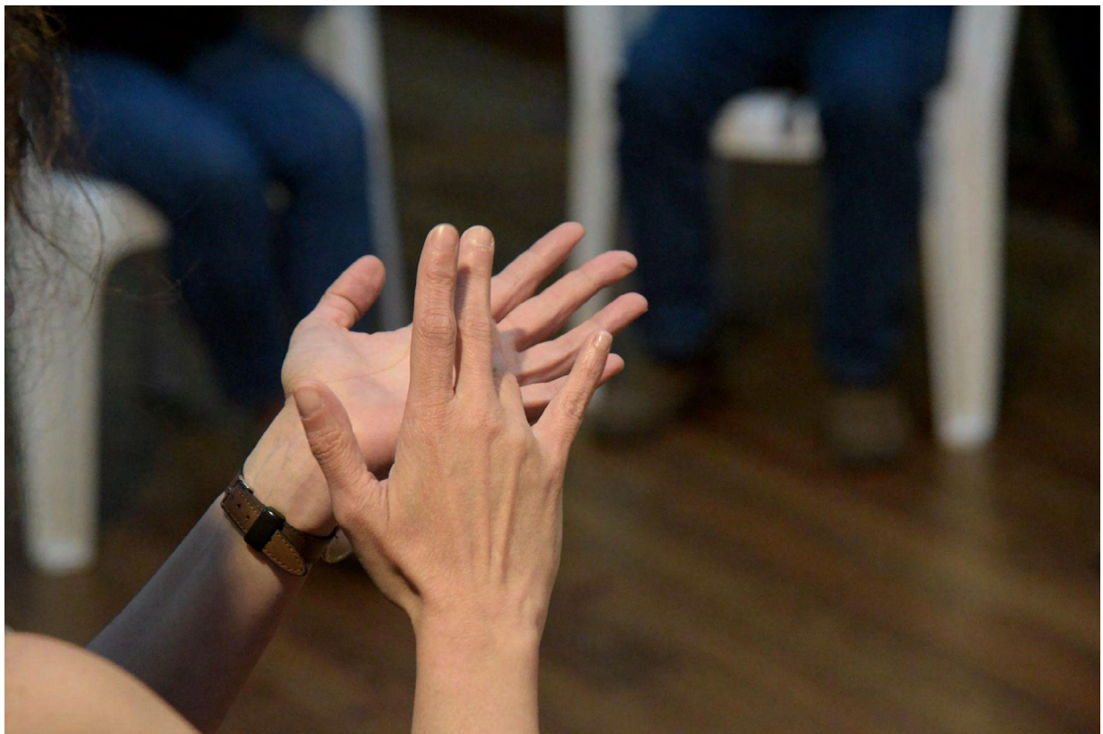
Figura 6: _DSC5476.jpg. Guillermo E. Sierra, 2022 Fotografías.