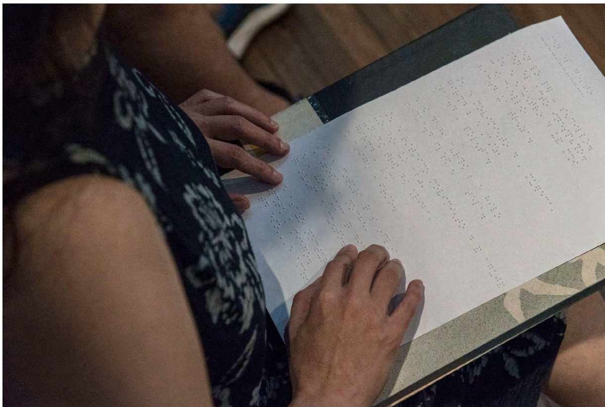
Figura 7: _DSC5640.