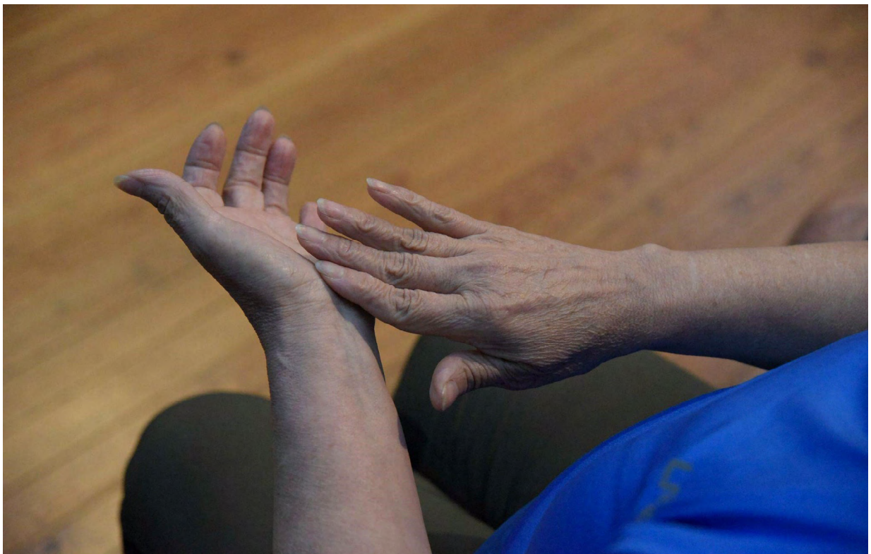
Figura 4: _DSC5409.jpg.