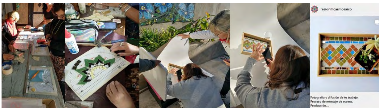
Figura 1: Practica musiva [1 y2]. Practica fotográfica [3 y 4]. Publicación en red social [5].

La técnica mosaica nos permite innovar, con materiales de uso común (retazos de azulejos, cerámicos, espejos, gemas de vidrio, vajillas, etc.) los espacios que conforman el hábitat se caracterizan por su perdurabilidad en el tiempo; permitiendo que atravesase ciclos y generaciones, conservando su estado. Así se busca subsanar la deficiencia al momento de explotar las posibilidades que brinda el oficio de mosaicista.