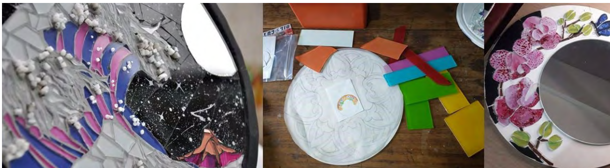
Figura 6. Productos realizados con vidrio pintado.

Taller de practica sobre soporte de madera, método directo: En este taller de práctica. nos encontramos con la falta de material de tipo azulejo, o mosaico veneciano. Desde el inicio del curso hemos planteado la resignificación de objetos y la reutilización de materiales que puedan tener en sus hogares. Las participantes propusieron traer vidrios, ver la posibilidad de su uso fue un desafío en el que fuimos avanzando clase a clase, entendiendo y conociendo el material. La problemática del vidrio es que se astilla y corta, su durabilidad esta comprobada en uso doméstico, pero no su uso en el exterior (se usa acrílico para dar color) y la perdurabilidad en el tiempo debido a su fragilidad.