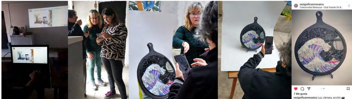
Figura 7. Taller de difusión. Clase teórica de fotografía [1]. Clase práctica de fotografía [2, 3 y 4]. Difusión [5].

abarca temáticas propias de la fotografía que fueron simplificadas para su posible realización con cualquier teléfono celular que posea cámara. Se reconocen los temas propios de la fotografía en general , pero haciendo hincapié en la fotografía de producto. Desde el armado de la escena, hasta la publicación final, incorporamos conceptos básicos como fondo, iluminación, puntos de vista, equilibrio, encuadre y composición de la imagen. Pasando por temáticas más técnicas relacionadas con el manejo de la cámara (ya sea del celular o de una cámara fotográfica profesional)