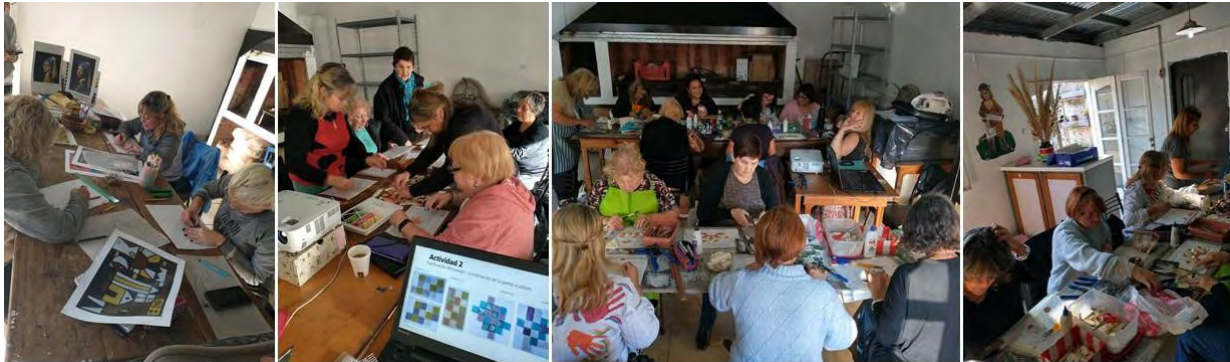
Figura 2: Trabajo en Taller de técnicas musivas. Fotografía de Mariel Ravara. Fotografía de Mariel Ravara.

ideas y necesidades propias, que tengan como objeto de estudio, los procesos y técnicas de elementos trabajados in situ para fortalecer la enseñanza y el aprendizaje y lograr la confección de diferentes productos para la mejora del hábitat de cada uno de los asistentes y el espacio del Club Social, Cultural y Deportivo Vostok de la Ciudad de Berisso