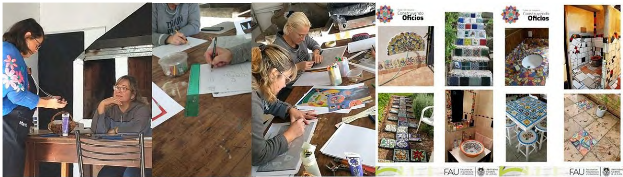
Figura 3. Taller de técnica musiva [1]. Taller de composición de imagen [2 y 3]. Posibilidades de uso [4 y 5].

Taller de practica sobre soporte de cemento: La elección del objeto a resignificar es parte del proceso de aprendizaje individual donde cada participante a partir de lo aprendido acerca del comportamiento de los materiales podrá evaluar qué es lo más conveniente para la intervención musiva aplicando los conceptos adquiridos en el Taller. Contaremos con una clase sobre el uso del color y el armado del círculo cromático sus armonías y complementarios, a cargo de la docente extensionista Arq. Carolina Bottega , como apoyo al momento de diseñar y elegir las mejores paletas de color para el proyecto.