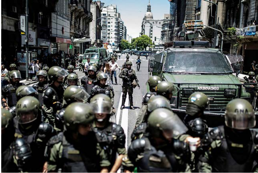
Figura 3. M.A.F.I.A., de la serie Ajuste y represión (2017). Fotografía digital.