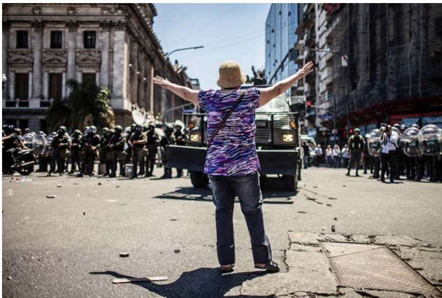
Figura 4. M.A.F.I.A., de la serie Ajuste y represión (2017). Fotografía digital.

En este sentido, las fotografías dan lugar a la construcción performativa de escenas ficticiales que no se producen de una vez (Soto Calderón, 2020), y que ponen en tensión las concepciones lineales del tiempo a partir de la recurrencia visual de un conjunto de rasgos que podemos considerar como anacrónicos (Didi-Huberman, 2008).