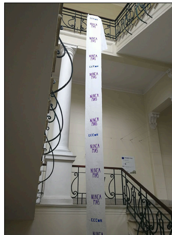
Imagen 1. Ciudad de La Plata Colegio Nacional «Rafael Hernández» (UNLP).

que operan como lugares de memorialización , es decir, marcas cuya función es recordar, homenajear y mantener viva la memoria de las víctimas (Huyssen, 2002). Todos estos gestos se conjugan, juxtaponen y conviven en un presente que se resignifica a los ojos de los contemporáneos. La escuela se convierte, así, en un territorio de memorias vivientes y un sitio para recordar.