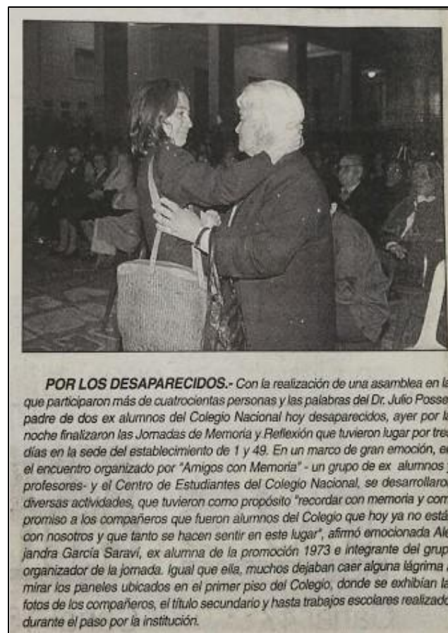
Imagen 4. Fuente: Diario El Día , 14 de septiembre de 1996 17 .