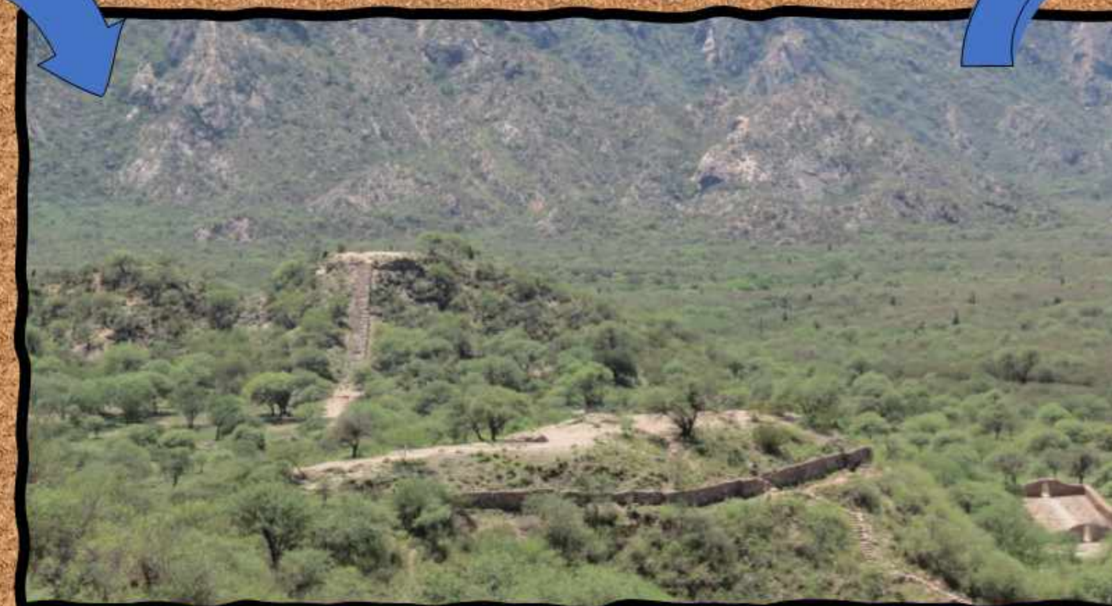
Panorámica del sitio