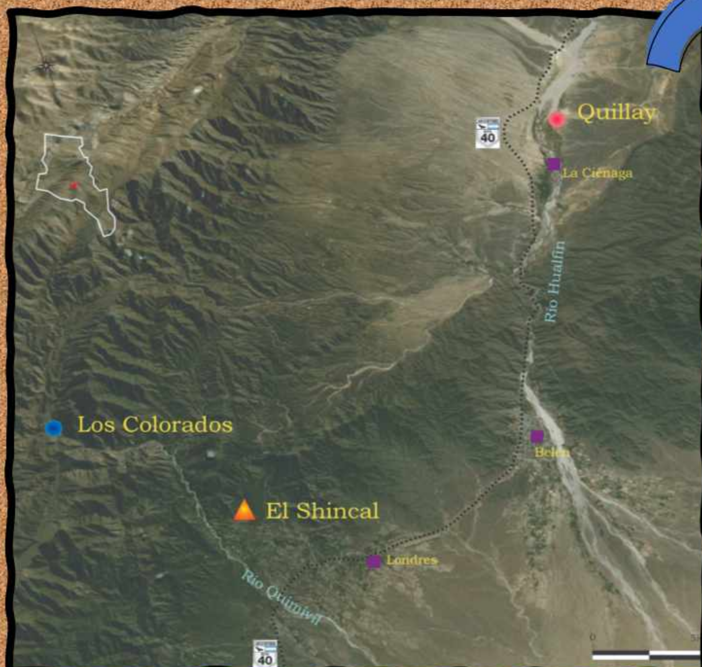
Ubicación de El Shincal de Quimivil en Catamarca