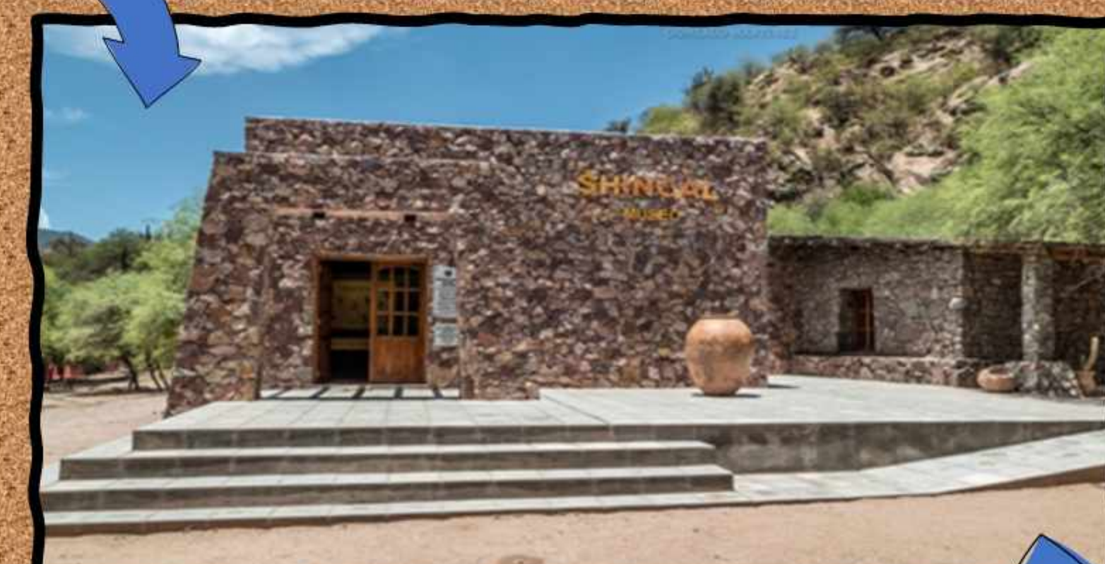
Nuevo museo desde 2015