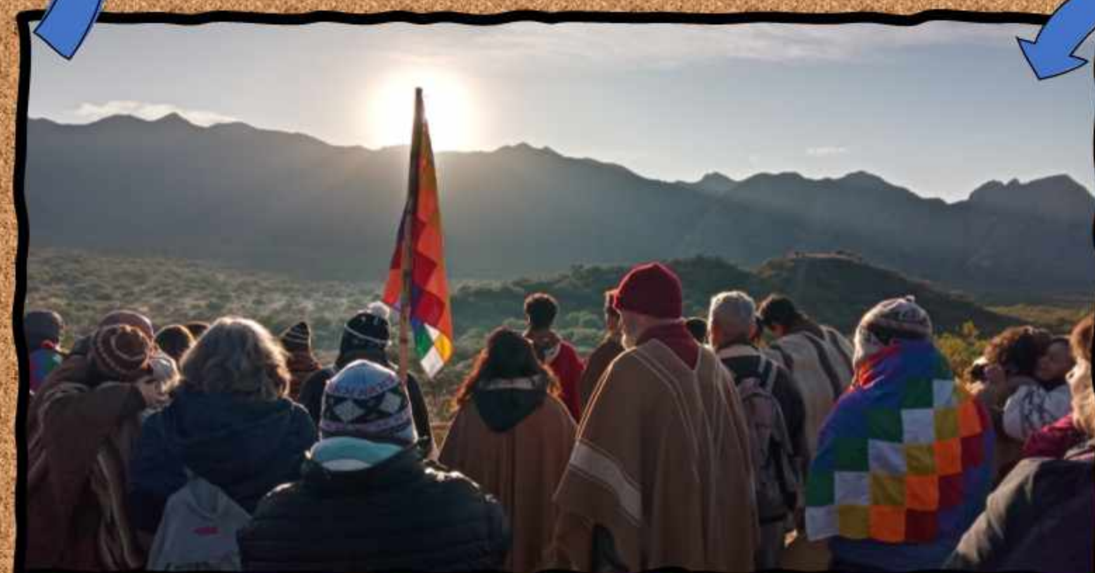
Esperando la salida de Tata Inti