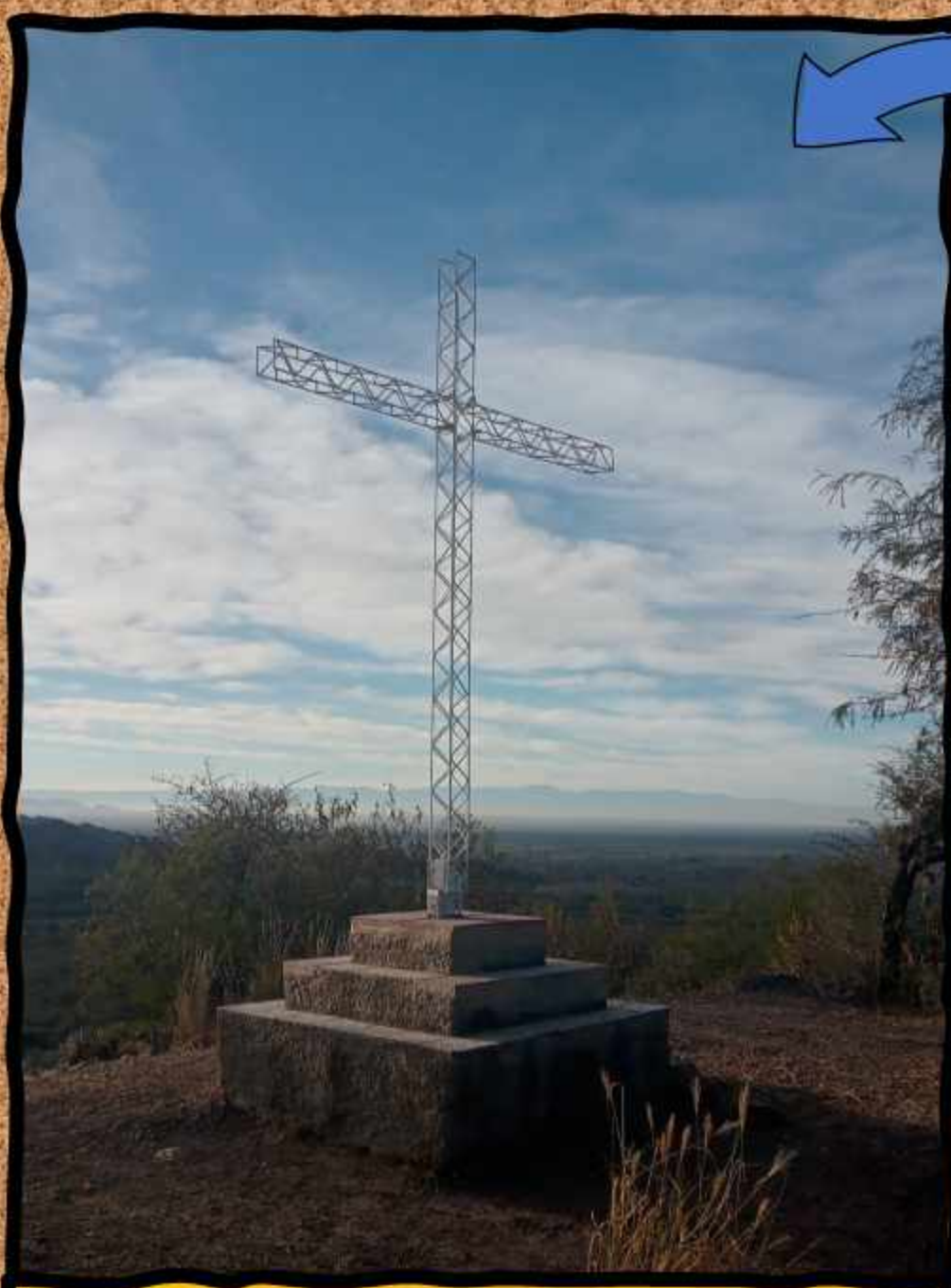
Cruz en la cima de la Loma Larga