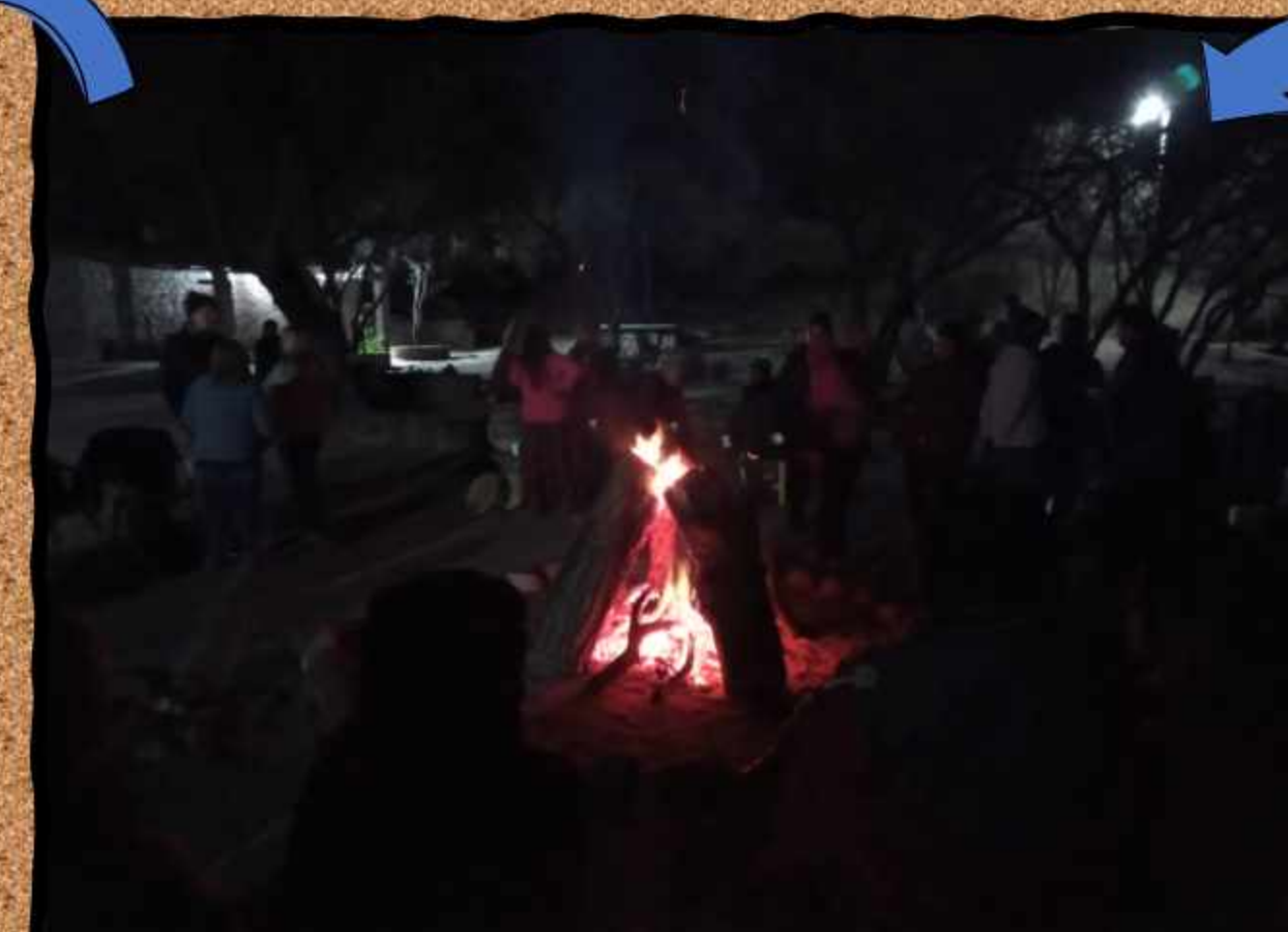
Noche en vela durante la ceremonia del Inti Raymi