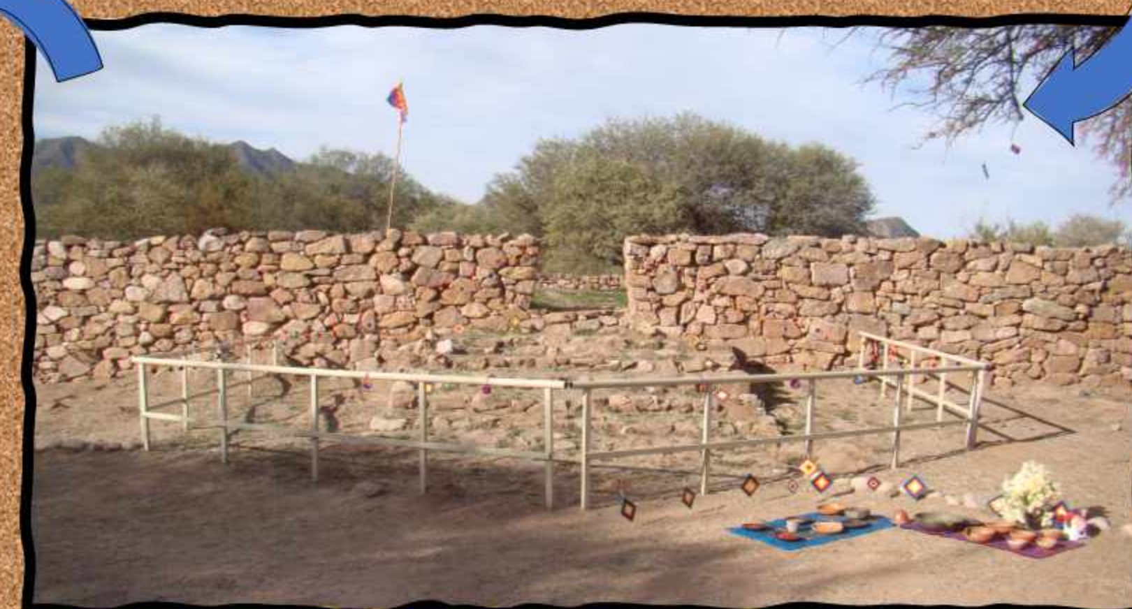
Ushnu decorado para celebrar el Inti Raymi