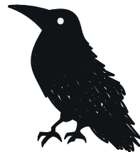
Ilustración Martina Pedragosa