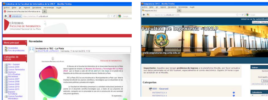
Fig. 2 – Plataformas Virtuales Moodle que se integran con SIU Guarani, de la Facultad de Informática e Ingeniería

La mejora continua, la integración de servicios y la ampliación de los mismos son nuestros objetivos principales ■