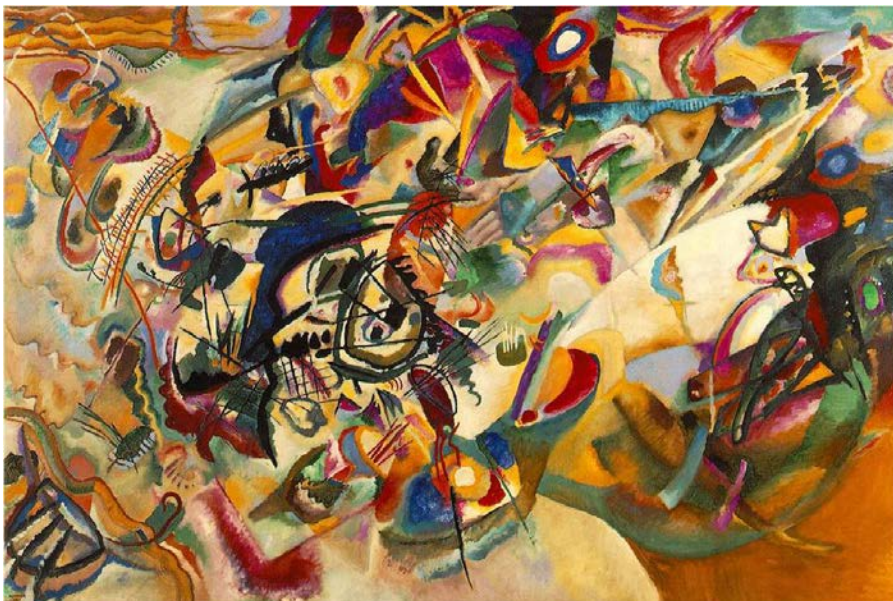
Wassily Kandinsky Composición VII, 1913

Como reflexión final, vale decir que en la actualidad las comunidades están debatiendo, construyendo conjuntamente, investigando o poniendo a disposición lo que descubren a través de las redes. Participar de la comunidad nos permite actualizarnos en la disciplina. El nuevo escenario que ofrece la tecnología e Internet tiene que ver con artículos, con materiales, con imágenes, con las wikis . Que cuando las reconocemos como valiosas debemos traspasarlas a los estudiantes para que ellos se involucren también en estos temas ■