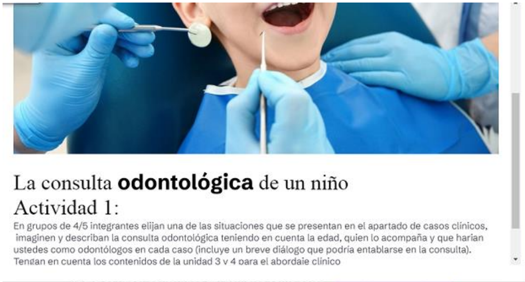
Fig. 2 Ejemplo de diseño de la actividad en Genial.ly®

Para desarrollar las actividades, los estudiantes se organizaron en pequeños grupos, seleccionaron un caso clínico y narrar una situación odontológica. Aquí entraban en juego sus conocimientos o experiencia previa (Fig 3).