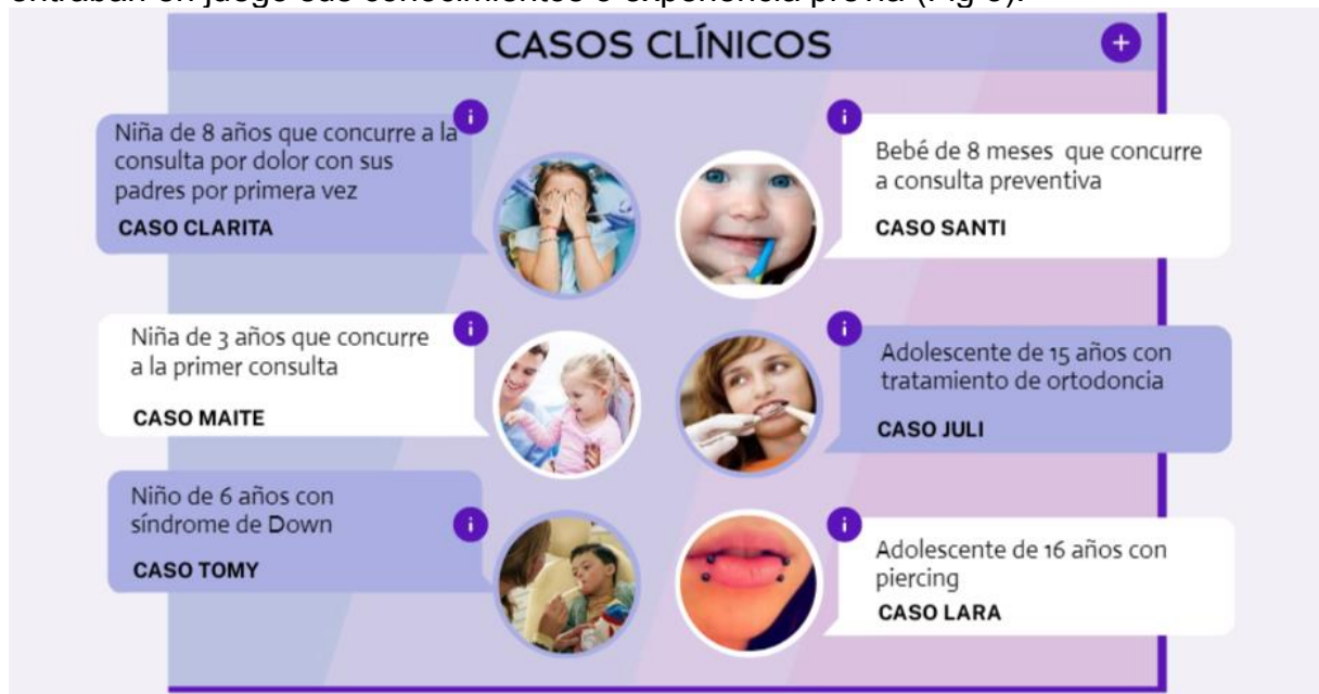
Figura 3 Casos clínicos disparadores.

Para desarrollar las actividades, los estudiantes se organizaron en pequeños grupos, seleccionaron un caso clínico y narrar una situación odontológica. Aquí entraban en juego sus conocimientos o experiencia previa (Fig 3).