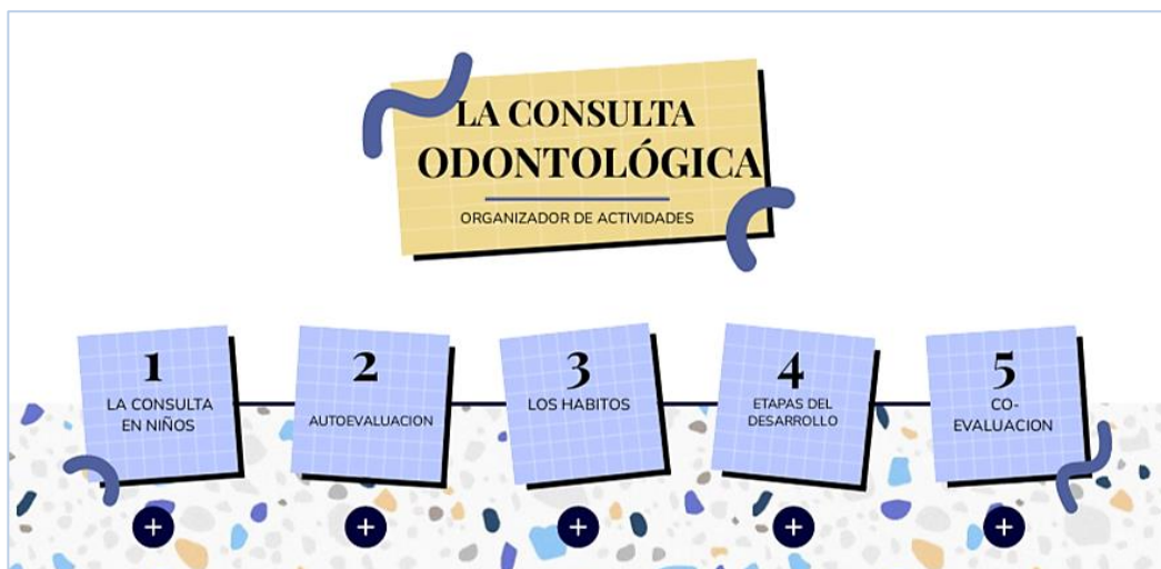
Fig. 1 Organizador de las actividades

En base a las etapas anteriores y a la elección del eje temático la relación paciente-profesional como articulador de tópicos sobre la atención de los pacientes en crecimiento, planeamos actividades de casos clínicos sobre posibles pacientes (casos disparadores). La secuencia didáctica se presentó mediante una plantilla de Genial.ly® embebida en el entorno virtual de la asignatura, donde se desplegaban las actividades a realizar, los requisitos de ejecución y los plazos de entrega (Figs. 1 y 2). Los temas abordados fueron: la consulta odontológica en niños, los hábitos y las etapas del desarrollo. Se incluyó una actividad de autoevaluación mediante una lista de cotejo y una instancia de evaluación entre pares. Esta última, además de estar programada en el muro virtual, se realizó durante las clases presenciales cuando cada grupo iba exponiendo los avances en su producción.