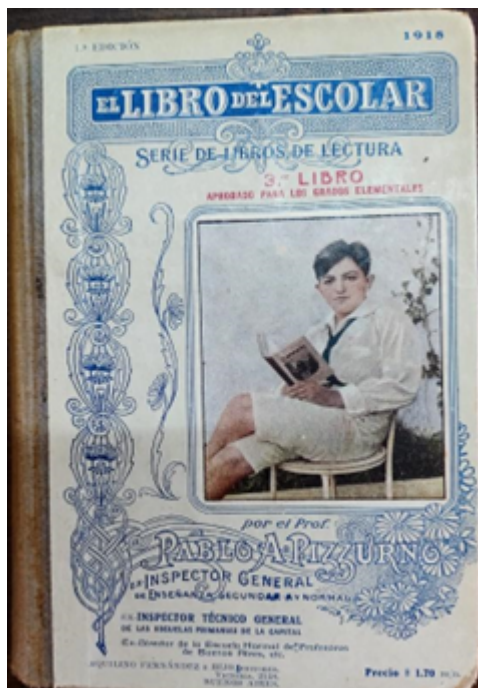
Figura 2 Portada El Libro del Escolar