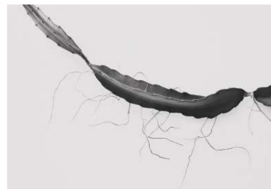
Imagem 2 – Kemper, 2021: ‘te extraño, pitaya’

vegetais que não estivessem na geladeira. Fotografei a cena de estranhamento coletivo. Quando a imagem apareceu na tela do celular e se apresentou pelo nome: ‘te extraño, cariño’.