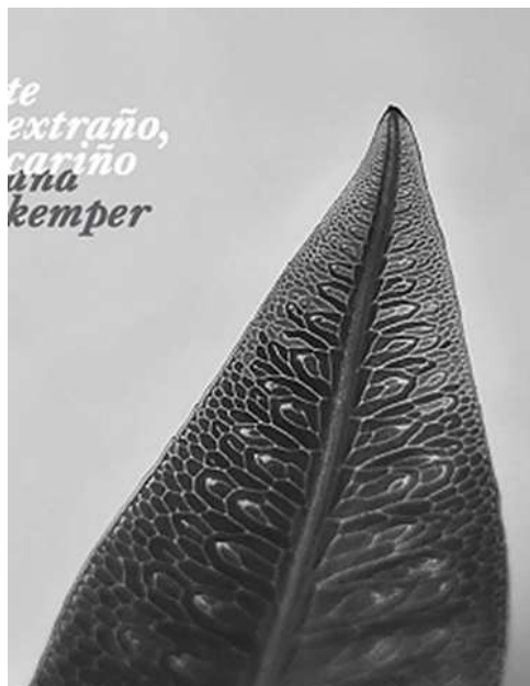
Imagem 1 – Kemper 2021 – cartaz da exposição ‘te extraño, cariño’ – acervo de artista

acontecendo a partir do estranhamento que me deixou em translação ao redor das novas companheiras vegetais?