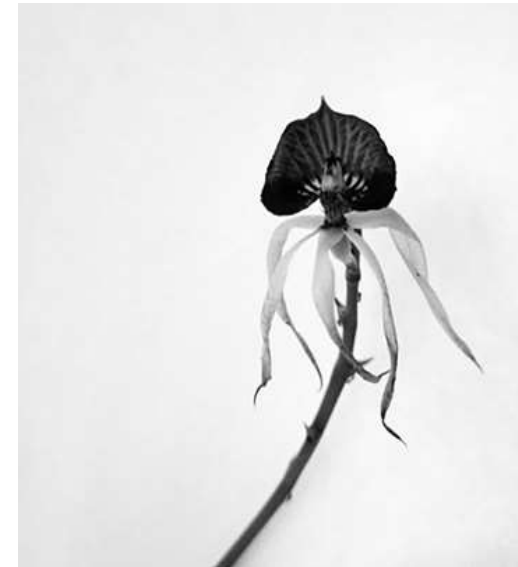
Imagem 7: Kemper, 2021 ‘te extraño, orquídea’

bolsista de iniciação científica, começo a elaborar alguns dos problemas que me geraram desconforto e me fizeram abandonar a pesquisa científica.