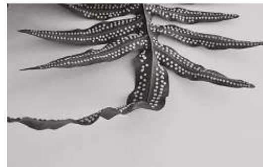
Imagem 6: Kemper, 2021 ‘te extraño, samambaia 2’ acervo da artista

“as plantas são comunicadoras perfeitas numa vasta gama de modalidades terrenas, produzindo e intercambiando significados em meio a uma poesia84a84ment galáxia de associados que atravessam táxons de seres vivos. Assim como poesia84a84 e fungos, as plantas são linhas de vida que poesia84a84 os animais com o mundo abiótico, do Sol aos gases, e às rochas.”