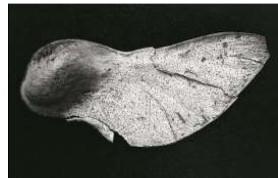
Imagem 4: kemper, 2021: te extraño, pau sangue acervo da artista

extrañar curas sanguíneas e amargas em folhas verde veludo do boldo.