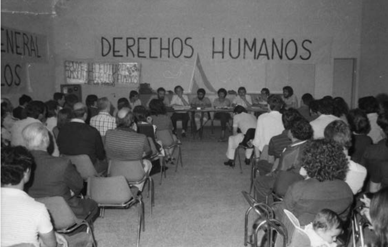
Imagen 5. Asamblea de conformación del MPPDH