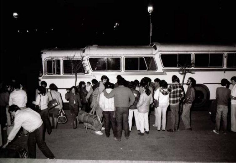
Imagen 3. Los estudiantes de la UNLPam ante de emprender el viaje hacia la ciudad de Tucumán, al congreso normalizador de la FUA