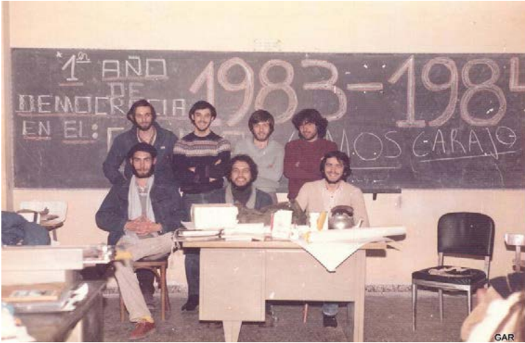
Imagen 1. Primera Comisión Directiva del CENUP, período 1983-1984