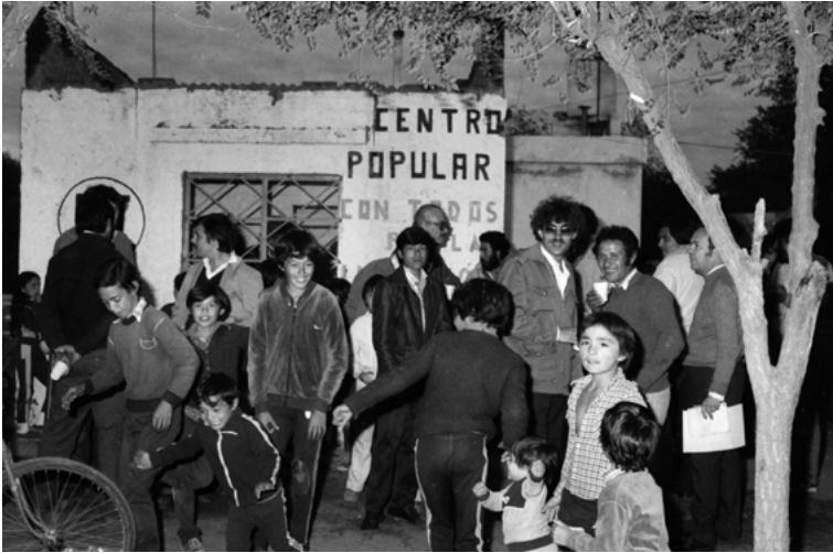
Imagen 4. Acto y peña en el Centro Popular “Con todos por la Liberación”, local del Partido Intransigente en una barriada de la zona norte de la ciudad. Noviembre de 1982