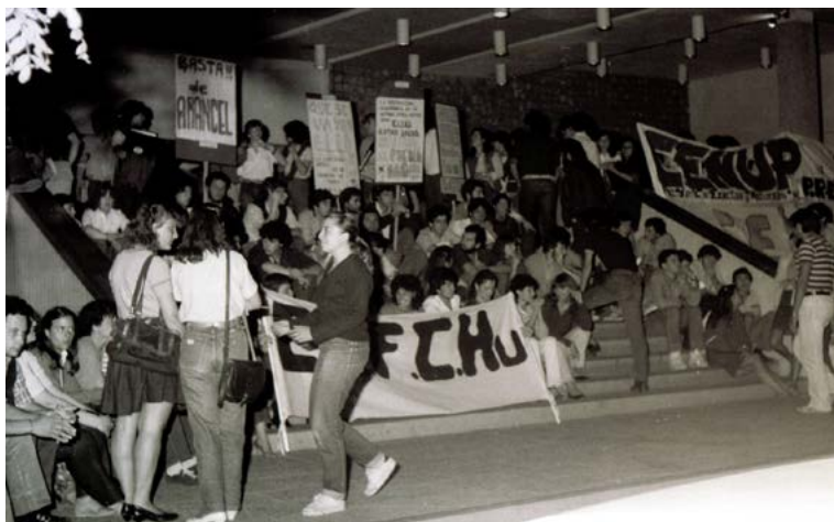
Imagen 2. Movilización estudiantil contra el pago de la última cuota anual del arancel universitario, noviembre de 1983