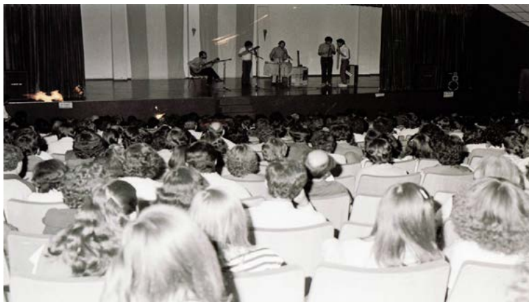
Imagen 6. Actuación musical del grupo Vilcabamba en el aula magna de la UNLPam, con motivo de la presentación del tercer número de la RU-Revista Universitaria, en noviembre de 1982