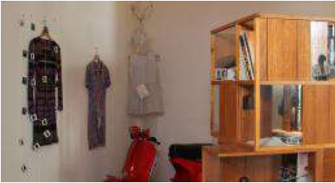
Imagen 6. “Sala de Objetos y de Vidas para ser Contadas” de la Comisión Provincial de la Memoria/ Ex D2 de Córdoba, Argentina