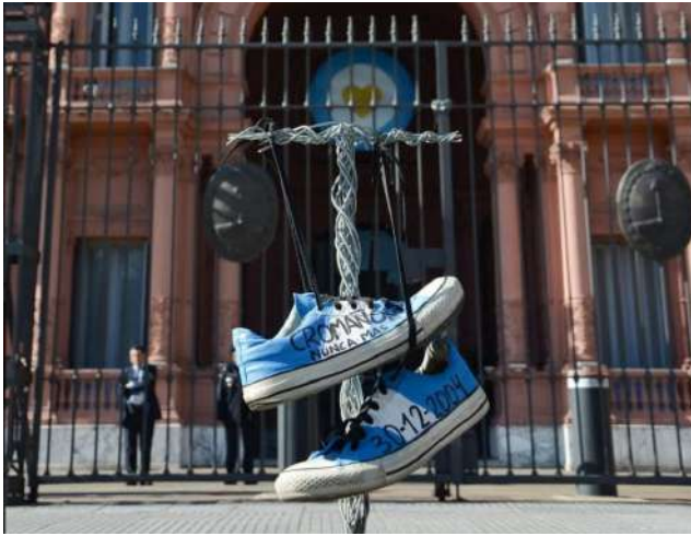
Imagen 8. Zapatillas colgadas que recuerdan a las víctimas de la Tragedia de Cromañón.