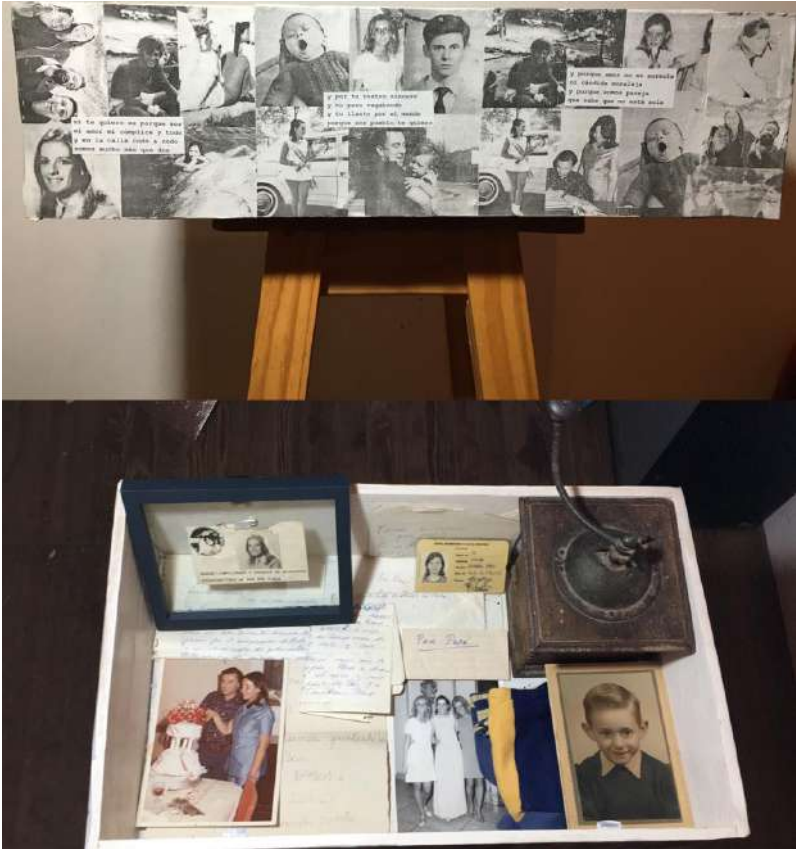
Imagen 12. Caja-objeto de los hijos/as de desaparecidos argentinos. Muestra (frustrada por la pandemia) preparada para los 25 años de la fundación en 1995 de la agrupación de Derechos Humanos H.I.J.O.S. en La Plata, Argentina.