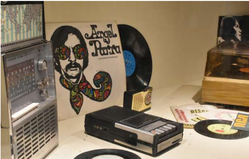
Imagen 2. Objetos de la muestra “Pequeñas y grandes Rebeldías” (2014) en el Espacio para la Memoria y la Promoción de los Derechos Humanos ex CCDTyE “La Perla”, Córdoba, Argentina.