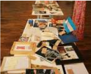
Imagen 3. Objetos de la vida cotidiana durante la dictadura argentina

complicidad de la sociedad con lo que estaba sucediendo, un debate que atraviesa tanto a la Shoah (la querrela de los historiadores o Historikerstreit; la polémica Broszat-Friedländer y los análisis de Daniel Goldhagen), como a la dictadura cívico-militar argentina en la cual se procura ir más allá de la teoría de los dos demonios para indagar en los grados de responsabilidad o de resistencia colectiva de aquellos sectores (partidos políticos, Iglesia, empresas, organizaciones sindicales y barriales, instituciones educativas, ciudadanía, etc.) que eran en principio considerados ajenos al régimen dictatorial.