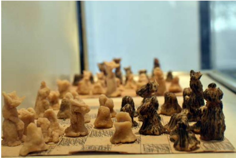
Imagen 4. Objetos de la muestra “(Sobre)VIDAS” (2010) en el Espacio para la Memoria y la Promoción de los Derechos Humanos ex CCDTyE “La Perla”, Córdoba, Argentina.