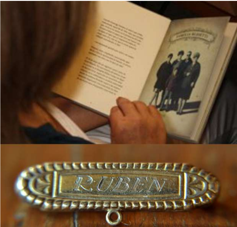
Imagen 5. Colección de libros “Dejame que te cuente” (y objetos de los desaparecidos) promovida por el Museo de la Memoria de Rosario, Argentina