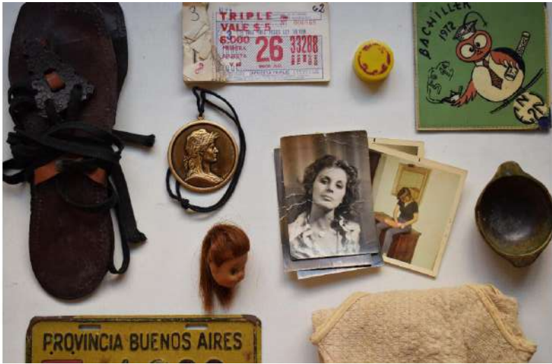
Imagen 13. Instalación “El abrazo de los objetos (ejercicios de memoria)” (2020), de Andrea Suárez Córica, La Plata, Argentina.