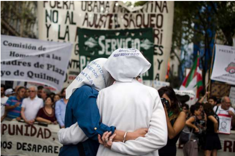
Imagen 7. Pañuelos de las Madres de Plaza de Mayo, Argentina.