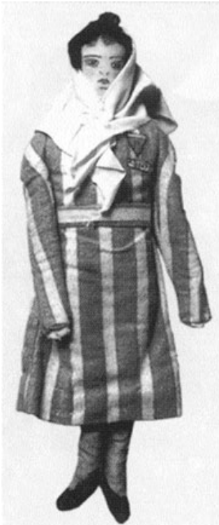
Imagen 11. Muñeca de trapo hallada en Auschwitz.

encontramos uno hallado en Auschwitz, vestido con el uniforme de los presos (imagen 11). También en esta muestra se exhibe un tablero para jugar al Turista Mundial, pero en lugar de que los infantes compraran propiedades, como es el juego normal, ellos compraban la cámara de gas. Si bien ahora, situados en museos y muestras, constituyen objetos que testimonian el exterminio de niños como parte del plan orquestado por el nazismo, en el momento de su creación dentro del campo estos juguetes fueron objetos performativos con los cuales los niños procuraban enfrentar, comprender y encauzar la violencia extrema que los amenazaba desde las herramientas de su propio universo infantil. Vamos a indagar ahora una serie de objetos referidos a los hijos de padres desaparecidos y víctimas del terrorismo de Estado en Argentina.