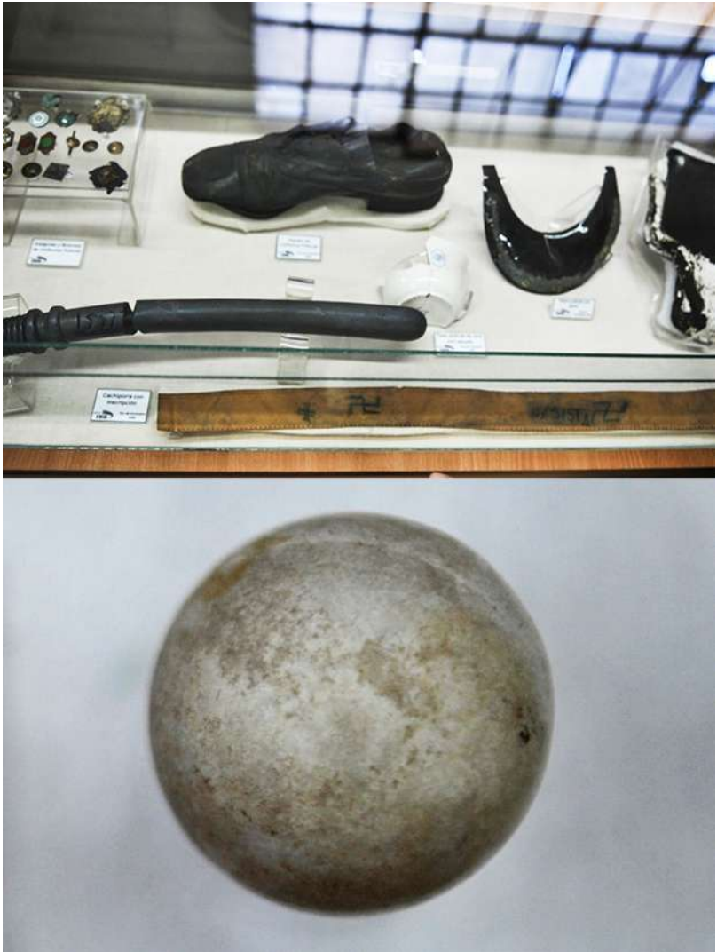
Imagen 1. Objetos encontrados en las excavaciones del ex CCDTyE Club Atlético de la ciudad de Buenos Aires, Argentina