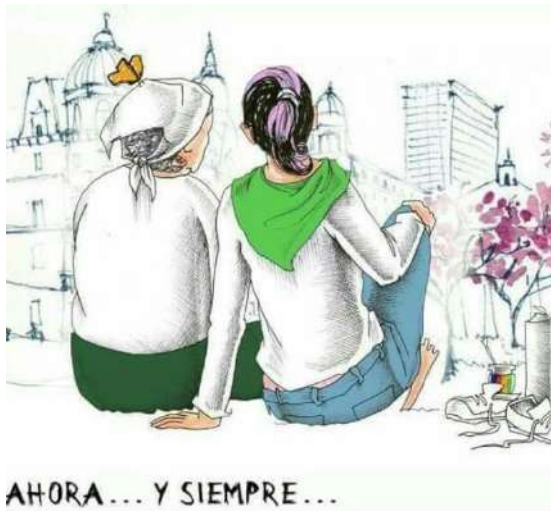
Imagen 3. “Marzo de los dos pañuelos”

Son múltiples las vías en que las hijas y los hijos establecen continuidades y se abren a nuevas militancias de diversa índole, entre las cuales podemos señalar, solo a modo de ejemplo, la actual lucha feminista del Ni Una Menos , las reivindicaciones como el aborto legal, la educación sexual integral, la reforma judicial con perspectiva de género, el cupo laboral travesti-trans, las denuncias de los femicidios, etc. En estas marchas y reclamos se recuperan los legados de las Madres y se actualizan algunas consignas como “Ni una menos, contra nuestros cuerpos Nunca Más”, “No olvidamos, no perdonamos, no nos reconciliamos”. Estos legados se simbolizan con el traspaso del pañuelo blanco al pañuelo verde, como sostuvo Gabriela Cerruti “Somos hijas de los pañuelos blancos y madres de los pañuelos verdes. Somos millones” (imagen 3). Asimismo, las/os hijas/os de los represores, que rechazaron a sus padres y fundaron el colectivo Historias Desobedientes: Familiares de genocidas por la Memoria, la Verdad y la Justicia , se presentan con sus propias banderas por primera vez el 3 de junio de 2017 en la movilización organizada por Ni Una Menos .