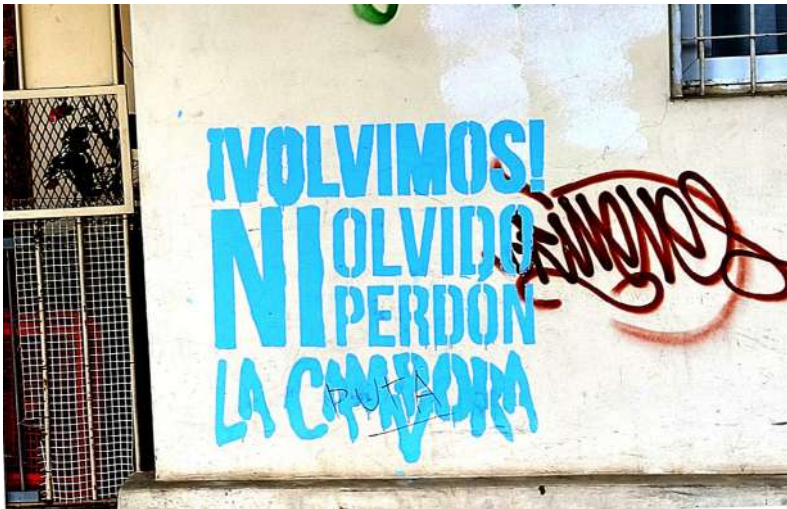
Imagen 2. Stencil de “La C mpora”

Fuente: Archivo fotogr fico de la autora.