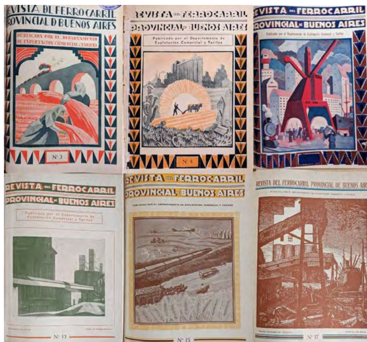
Figura 1. El ferrocarril, el barco de vapor, el automóvil, el avión y los rascacielos, parte central de las expectativas modernas sobre el futuro, presentes en las portadas de la revista

Al examinar las portadas de la revista, se puede observar la perspectiva del gobierno provincial sobre la modernización, destacando avances tecnológicos y logros económicos relacionados con la producción agropecuaria. Esta visión de progreso continuo, consolidada desde la revolución científico-industrial (Dator, 2017), se vio reforzada por los nuevos materiales y construcciones que transformaron las ciudades a finales del siglo XIX, tales como vidrieras, espejos, arquitecturas de acero y cristal, e iluminación eléctrica. Estos elementos, descritos por Walter Benjamin en su tránsito por la ciudad moderna, modificaron la percepción del entorno e impulsaron la creación de imágenes sobre el porvenir (Suárez Guerrini & Gustavino, 2023), como las que se encuentran en las portadas [Figura 1].