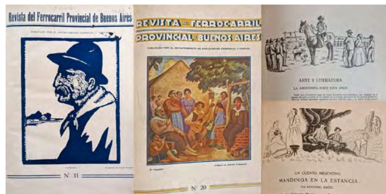
Figura 3. Selección de motivos de origen precolombino presentes en las páginas de la revista

¿La revista demuestra un compromiso con el americanismo? En el capítulo VI de «El ideal» del Silabario de la Decoración Americana, Ricardo Rojas —quien proponía que el arte nacional debería integrar elementos precolombinos y coloniales para establecer una gramática de la ornamentación argentina (Fasce & Mantovani, 2022)— explora cómo los símbolos americanos se integraron en las artes del libro, desde ilustraciones hasta carátulas renacentistas, adaptando motivos arqueológicos tanto en Europa como en América. Rojas señala que aquí esta tendencia también aconteció en la prensa periódica, como en Riel y Fomento , donde se emplearon «ornamentos euríndicos en el arte de imprimir» (Rojas, 1930, p. 261).