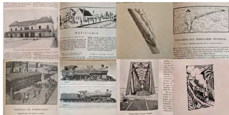
Figura 2. Imágenes del ferrocarril y su nueva infraestructura (rieles, estaciones, puentes)

Por supuesto, es igualmente importante la presencia del ferrocarril, abriéndose paso sobre los rieles a través del paisaje, con su característica chimenea humeante [Figura 2]. Esta iconografía ferroviaria se despliega a lo largo de las páginas en diversas formas, ya sea a través de ilustraciones, pequeñas viñetas o fotografías de las nuevas maquinarias adquiridas por la empresa, que ilustran también, como se mencionó anteriormente, la nueva arquitectura ferroviaria que emerge en forma de estaciones y puentes de acero.