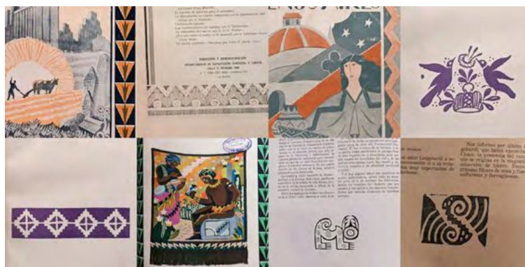
Figura 4. Escenas y retratos donde se hace presente la figura del gaucho y sus costumbres

Por ejemplo, en el primer número se publicó «Una fiesta en La Pampa de Ricardo Güiraldes», acompañado por una reproducción de la acuarela El cielito (1831) de Carlos Enrique Pellegrini, que mostraba gauchos y paisanas bailando la danza tradicional de la región pampeana bonaerense. Los nombres de los escritores