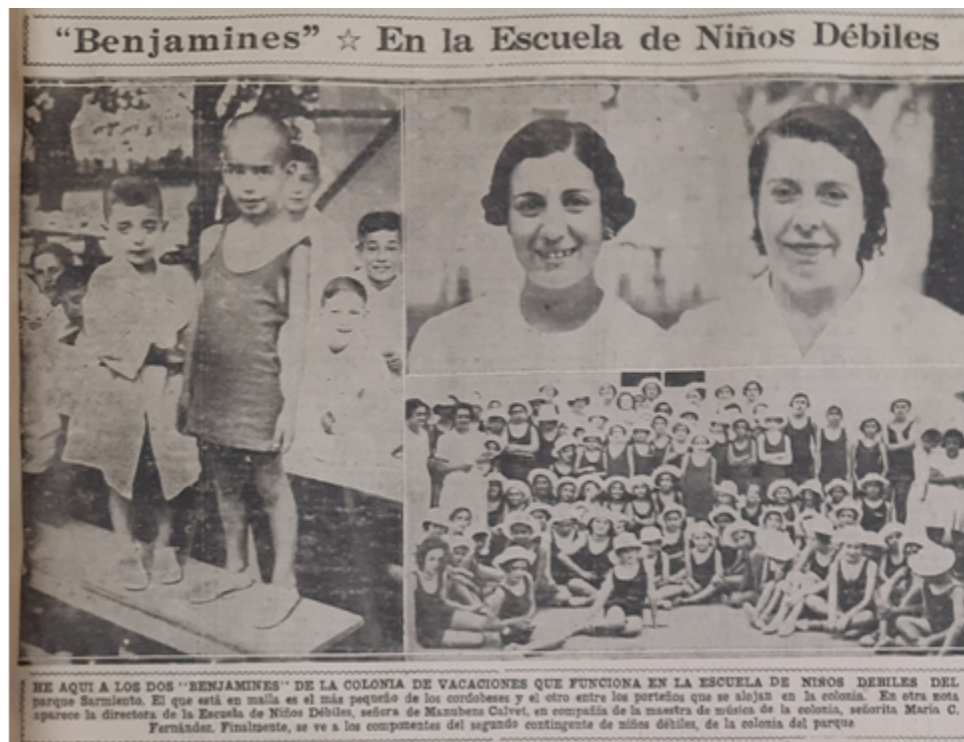
Figura 1 “Benjamines” en la escuela de niños débiles