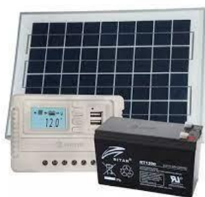
Fig. 7. Kit solar compuesto por un panel solar, un regulador de carga y una batería.

En relación a la eficiencia de la rutina del nodo, se plantea continuar con pruebas de optimización de bajo consumo, para prolongar la vida útil de la batería y así maximizar la autonomía del nodo.