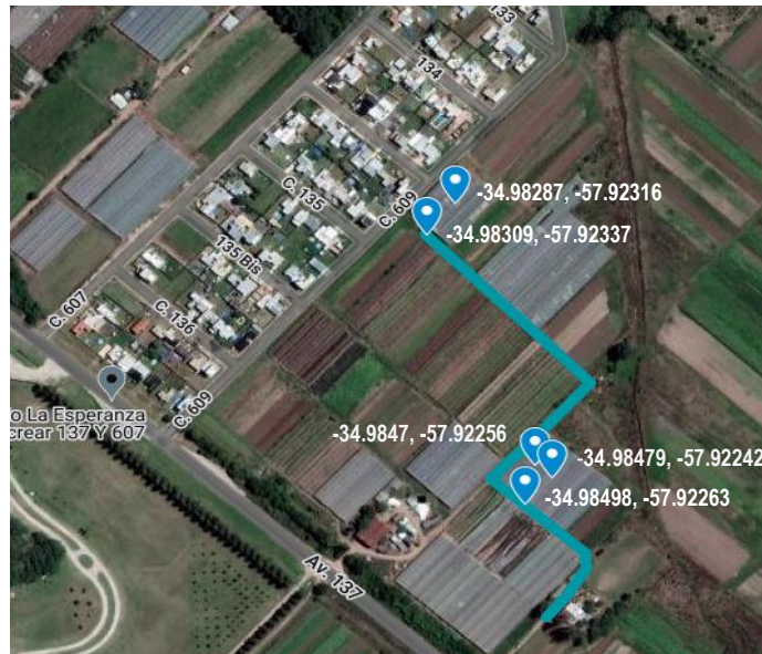
Fig. 1. Geolocalización de los puntos de medición del nodo de prueba en los invernaderos

El resultado de las mediciones realizadas se describen en la Tabla 1. A pesar que los datos obtenidos dan cuenta de paquetes que llegan a destino con señales cercanas al umbral de sensibilidad o intensidad de señal recibida mínima permitida (RSSI), la cantidad de los mismos resultó aceptable para los fines del proyecto. Como se puede observar en la misma tabla la zona correspondiente a las filas amarillas presenta la mejor calidad de transmisión (valores de RSSI alejados de -129 dBm) y por lo tanto resultó la zona seleccionada para la implantación del nodo LoRa.