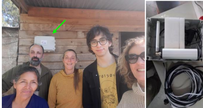
Fig. 4. Gateway LoRaWAN instalado en el frente de la casa de la familia productora.