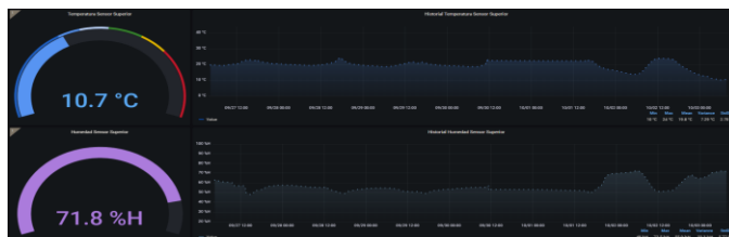
Fig. 6. Recepción de los datos con la arquitectura de comunicación.