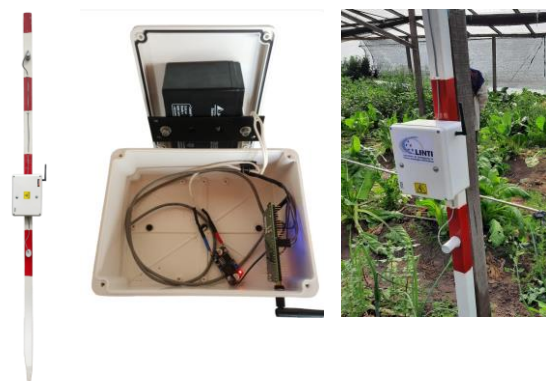
Fig. 2. Nodo LoRa de sensado de datos microambientales a instalarse en los invernaderos.

A partir del resultado del estudio de factibilidad se diseñó y construyó un nodo LoRa para instalarse en los invernaderos, como se muestra en la Fig. 2.. El nodo está compuesto por un microcontrolador ESSA-IOT 5.0 con antena de 915 MHz 5dbi SMA, dos módulos DHT22 (sensores de temperatura y humedad ambiente), un step-down 12 V - 3,5 V y una batería de gel de 12V para alimentar el nodo. Todos los elementos fueron dispuestos en una estructura con sus respectivas cajas de protección.