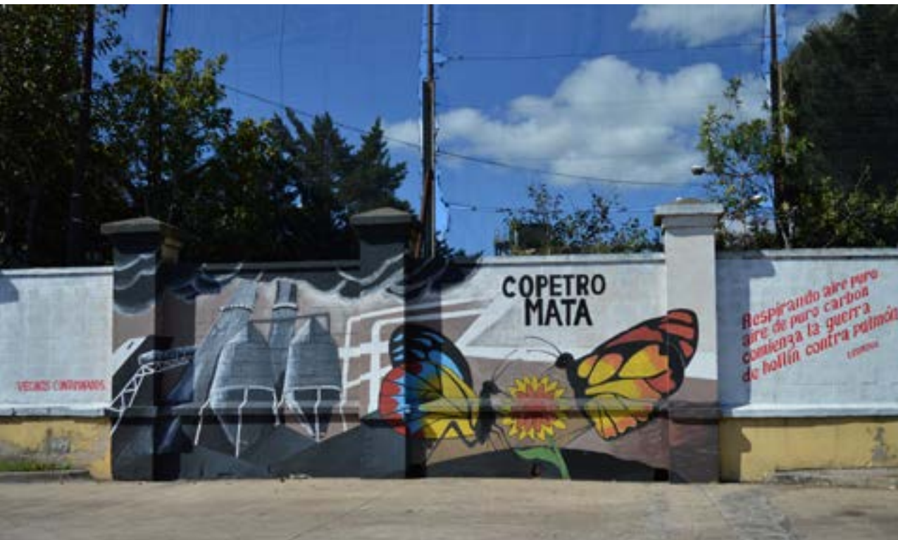
Figura 5. Mural realizado sobre los muros exteriores de la fábrica Copetro, Ensenada.

expresan en redes sociales oficiales que el verdadero Museo a Cielo Abierto es Copetro (Prensa Ensenada, 2021), aspecto que habilita lecturas y reflexiones sobre cómo se configuran en la ciudad de Ensenada en general, y en el barrio Campamento en particular, procesos de identificación local, en los que coexisten diversas miradas que lejos de converger, conforman una mixtura de interpretaciones que en ocasiones se enfrentan.