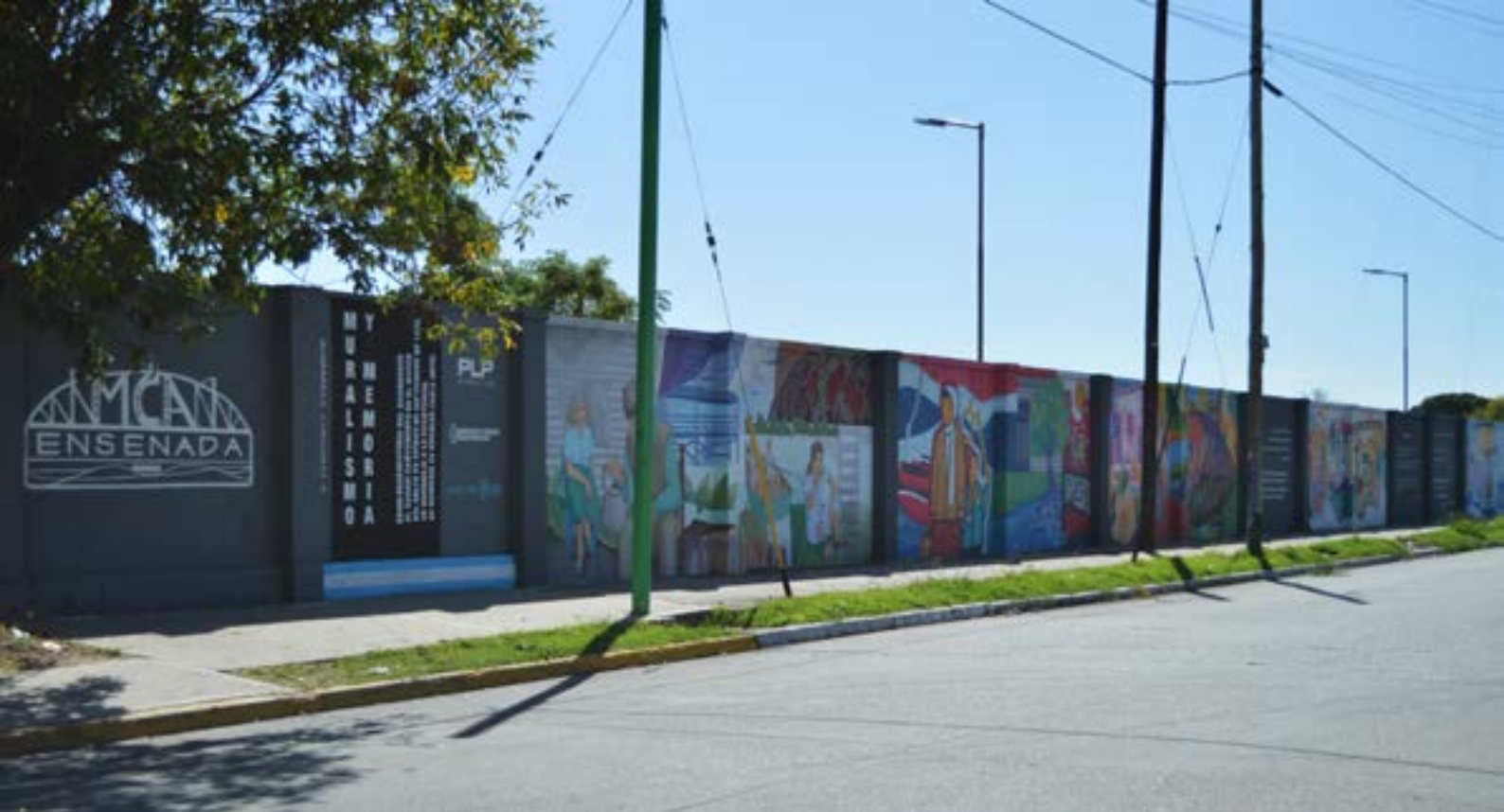
Figura 2. Vista general del Museo a Cielo Abierto Muralismo y Memoria.