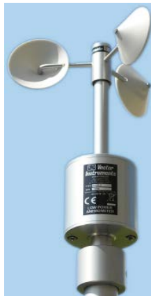
Figura 1- Anemómetro utilizado en la intercomparación