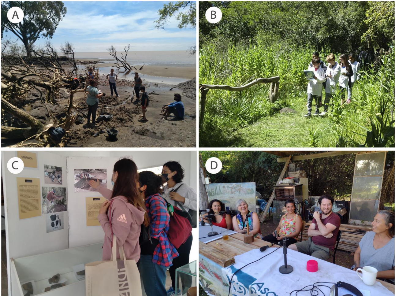
Figura 2. Distintas tareas realizadas por el equipo: A- rescate de material arqueológico en Playa Mamboretá, Punta Indio, Buenos Aires, Argentina (año 2022); B- mapeo colectivo en el marco del proyecto de extensión “Todas las Voces del Parque” (año 2018); C- muestra de arqueología “Un viaje a nuestro pasado” (año 2021); D- participación en la Radio Comunitaria de Punta Indio (año 2022).