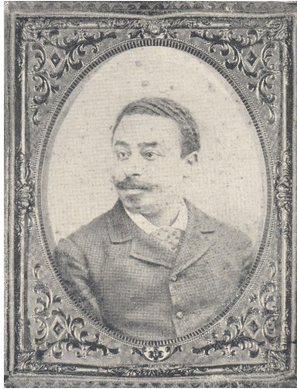
Uno de los pocos retratos de Zenón Rolón conocidos, en este caso un ambrotipo de c.1870 (Gesualdo 1961: 464).