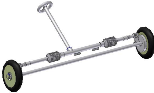
Barral de dirección en 3D resuelto por los docentes Zelaya, Taramazzo y Yegrós