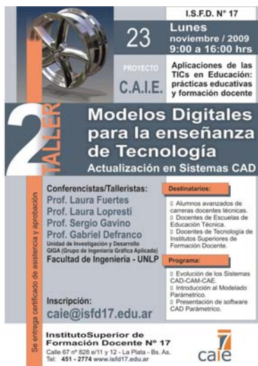
Afiche de Promoción del Taller Modelos Digitales para la enseñanza de Tecnología

Las acciones de articulación entre la Unidad de Investigación y Desarrollo GIGA (Grupo de Ingeniería Gráfica Aplicada) y el Centro de Actualización e Innovación Educativa del I.S.F.D. N° 17 de la ciudad de La Plata, fueron posibles a través del proyecto Aplicaciones de las TICs en Educación . Dicho proyecto surge como propuesta del I.S.F.D. N° 17 al Programa de Renovación Pedagógica del Ministerio de Educación, Ciencia y Tecnología de Nación. El Proyecto es financiado por el BID a través del PROMEDU (Programa de Apoyo a la Política de Mejoramiento de la Equidad Educativa), y en el caso de la Provincia de Buenos Aires, supervisado por la Dirección de Educación Superior, en el marco de las políticas para la formación docente definidas por la Dirección Nacional de Gestión Curricular y Formación Docente. Para ello, se realizaron diversos acuerdos con especialistas externos al I.S.F.D. N° 17 entre ellos los integrantes de la UID-GIGA.