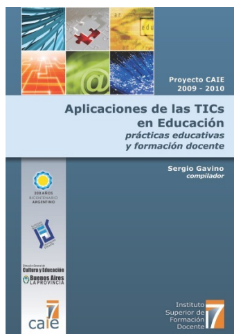
Portada del Libro Aplicaciones de las TICs en educación: prácticas educativas y formación docente ISBN 978-987-26253-0-6. Fecha de catalogación: 29/09/2010