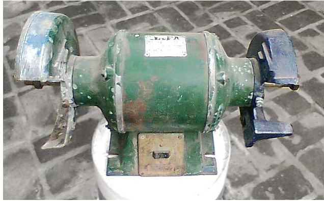
Imagen del modelo seleccionado: motor de corriente alterna.