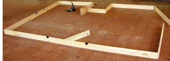
Fig.2 Entorno parcialmente estructurado de prueba.

Se concluye que: El desarrollo del sistema experto basado en reglas junto con la disposición adoptada en la distribución de sonares e implementada en el prototipo del robot móvil autónomo, satisface aceptablemente y a muy bajo costo, la navegación indoor y la evasión de obstáculos en entornos parcialmente estructurados.