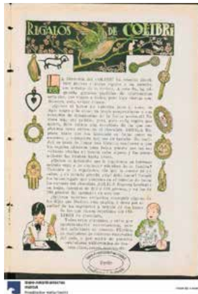
Figura 12. “Regalos de Colibrí”