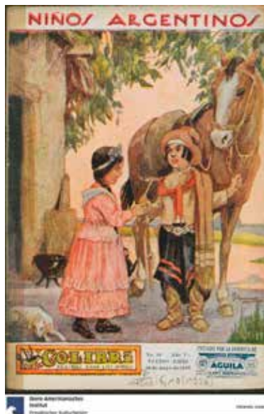
Figura 24. “Niños argentinos”