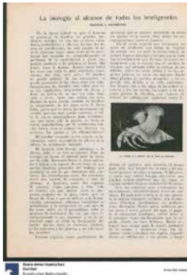
Figura 9. “La biología al alcance de todas las inteligencias”, Mundo Estudiantil