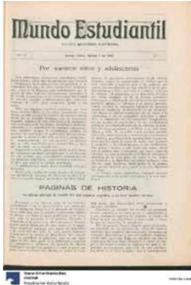
Figura 8. Mundo Estudiantil (1915)