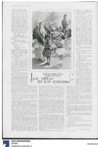
Figura 4. “Los niños en los jardines”, Plus Ultra , a. 2, n. 9, 1917