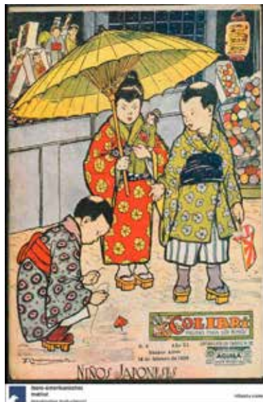
Figura 20. “Niños japoneses”