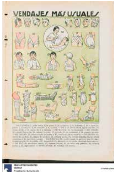
Figura 15. “Vendajes más usuales”