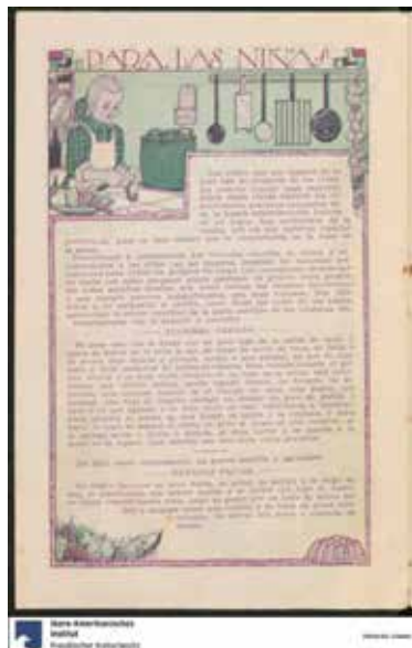
Figura 18. “Para las niñas”