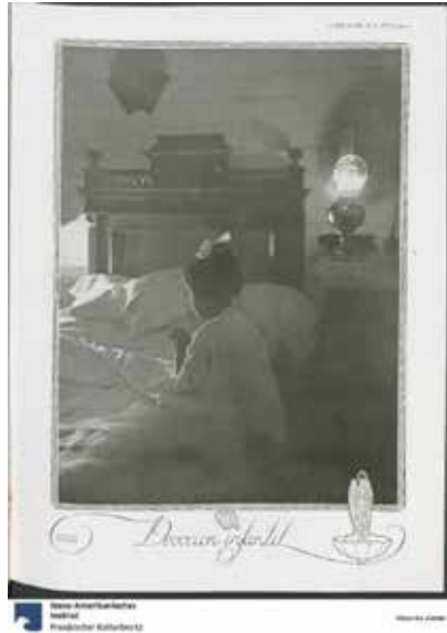
Figura 3. “Devoción infantil”, Plus Ultra , a. 4, n. 37, 1919