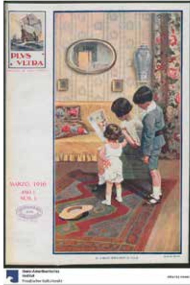
Figura 1. Plus Ultra , a. 1, n. 1, marzo de 1916. Portada