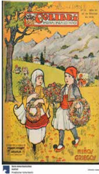
Figura 23. “Niños griegos”