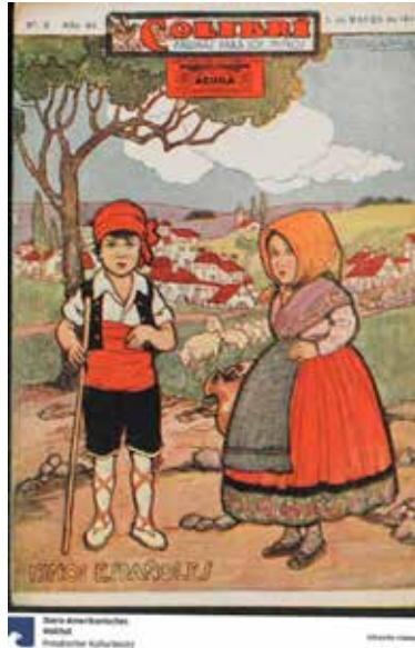
Figura 21. “Niños españoles”