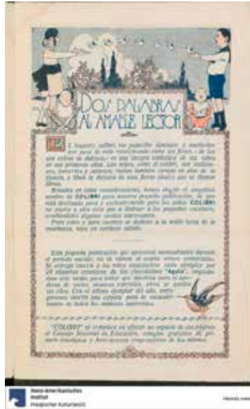
Figura 11. “Dos palabras al amable lector”, Colibrí , a. 1, n.1, 1921