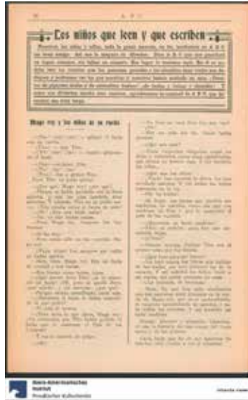
Figura 5. “Los niños que leen y que escriben”, A.B.C. Revista semanal de literatura amena y variada, n. 1, 1914