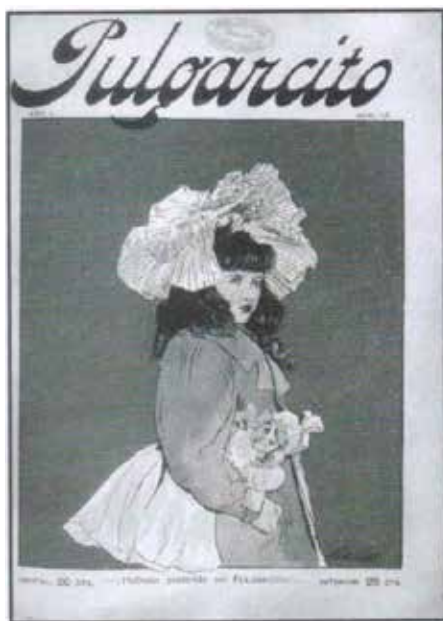
Figura 7. Pulgarcito (1904)