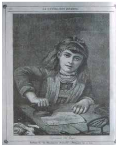
Figura 6. La Ilustración Infantil (1886-1887)