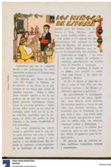
Figura 22. “Los niños de España”