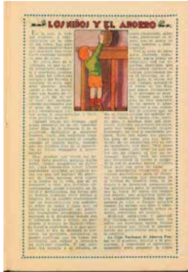
Figura 17. “Los niños y el ahorro”