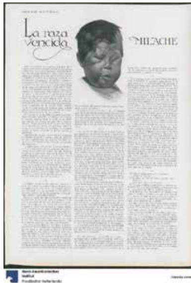
Figura 2. "Milache. La raza vencida", Plus Ultra , a. 1, n.1., marzo de 1916