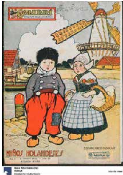
Figura 19. “Niños holandeses”