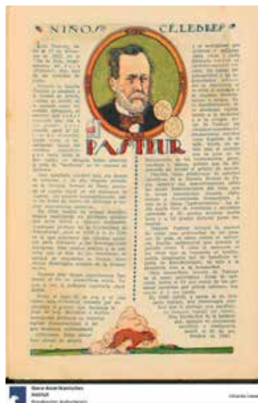
Figura 16. “Niños célebres. Pasteur”