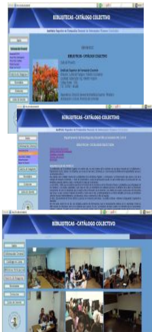
Figura 2. Algunas Interfaces ilustrativas de las funcionalidades del catálogo colectivo de Bibliotecas