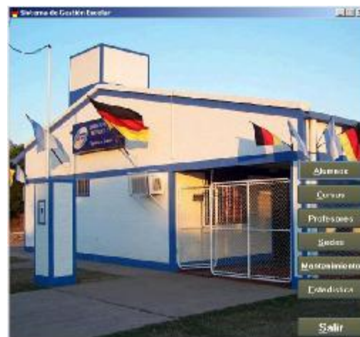
Figura 3. Interfaz inicial del sistema de formación profesional.

Asimismo, la versatilidad de los artefactos de software descriptos, facilitará su adecuación para la implementación en otras instituciones educativas de la región NEA aportando al desarrollo local.