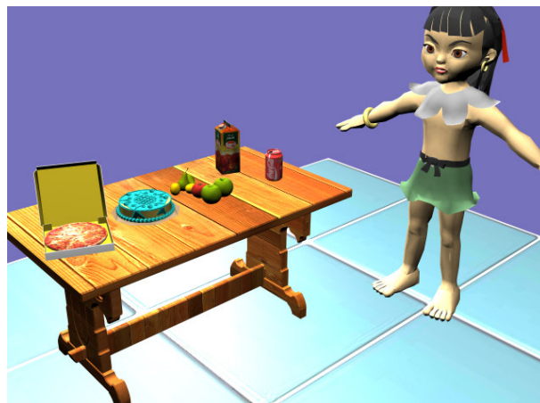
(Escena del personaje principal "Eli" y la comida que tomará).