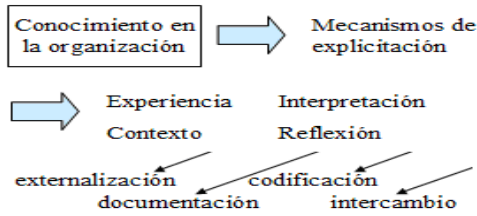
Fig. 1: Aspectos de gestión de conocimiento (KM)