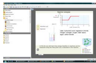
Figura 3: Crocodile Chemistry

El objetivo de esta comunicación es presentar el avance respecto de la evaluación de las aplicaciones específicas para la enseñanza de la Química en tanto que se delimitan los indicadores a tener en cuenta. Para ello se han tomado los tres laboratorios que se mencionan.