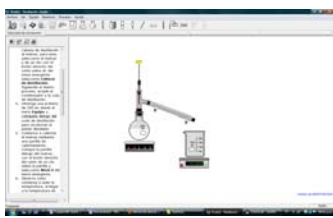
Figura 2: VLabQ