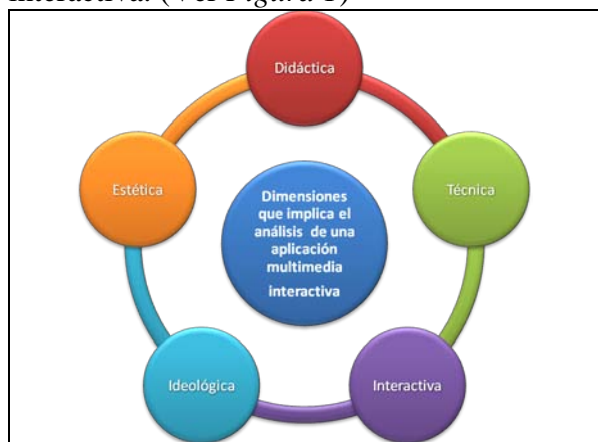
Figura 1: Adaptado de Gutiérrez Martín, A. (2003)

Gutiérrez Martín (2003) y a las mismas se le suma una quinta dimensión que es la interactiva. (Ver Figura 1 )