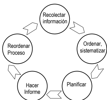
Figura 1: Gestión de la Información

Inicialmente se los usó para documentar el aprendizaje en áreas curriculares en las que no se podía evaluar en la forma tradicional. Como este instrumento se relaciona con los procesos de aprendizaje, permite identificar el camino hacia la apropiación conocimiento y seguir su evolución, detectando problemas de