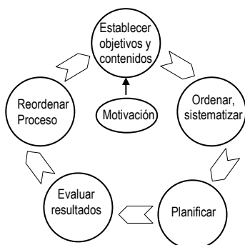
Figura 2. Ciclo de trabajo en e-portafolio

– La autorreflexión crítica de los estudiantes al reflejar interpretaciones y experiencias, detectar carencias, necesidades e intereses [9].