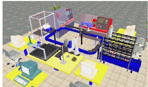
Figura 1: Células de fabricación para procesos automatizados basados en robots

transformando más adecuadamente los contenidos científicos, fomentando a su vez, una mayor reflexión y elaboración de los contenidos tratados. Desde el punto de vista tecnológico constituye un banco para el estudio de problemas de aplicación directa en la industria con fuerte incidencia en el sector nacional para procesos de desarrollo y automatización. A continuación se citan algunas de las características que el programa diseñado debe permitir realizar en la fase de simulación: a) Modelizar rápidamente nuevas células de fabricación para procesos automatizados basados en robots y evaluar su eficacia (Figura 1), b) Poner de manifiesto, mediante simulación gráfica, el diseño a implementar (Figura 2), c) Detectar colisiones del robot antes de que se produzcan en la instalación real, evitando así desperfectos ocasionados por una inadecuada ubicación del robot y/o una errónea programación, d) Calibrar el robot y su espacio de trabajo (Figura 3) 1 . El software de simulación puede ser utilizado para el diseño de cualquier proceso automatizado.