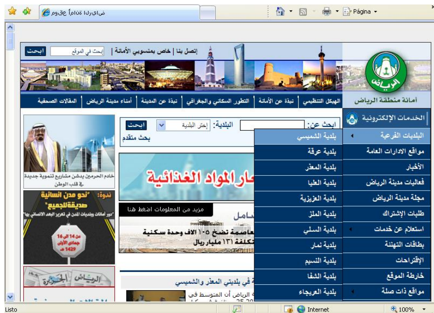
Figura 2: Página Principal de la Municipalidad de Riad (Arabia Saudita)

Analizando sólo estas 2 consignas, no cabe duda que son de carácter universal. Es por ello que las pautas de accesibilidad pueden aplicarse a sitios web, sin importar los aspectos culturales de los destinatarios o la finalidad de los mismos (educativos, gubernamentales, comerciales, etc.). Por este motivo, las pautas de accesibilidad propuestas por W3C han sido reconocidas como válidas a nivel