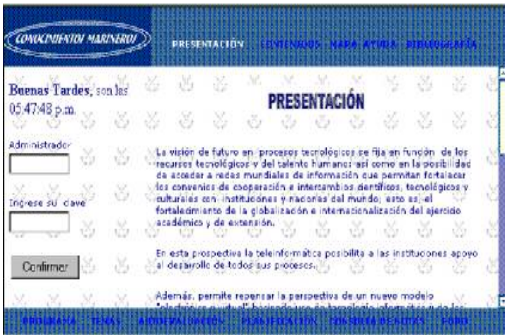
Figura 1. Interfaz inicial.