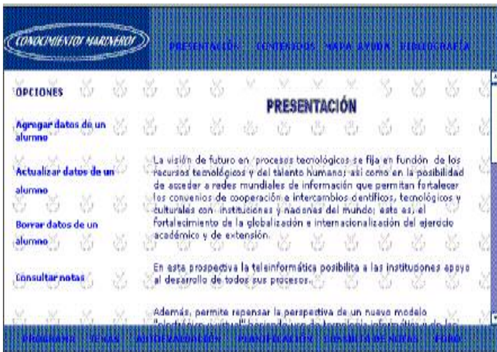
Figura 2. Opciones de administración definidas para los usuarios identificados por el sistema.

La potencialidad de las TICs en la educación es incuestionable, brinda recursos como: el correo electrónico, la transferencia de archivos, la búsqueda de información y fuentes bibliográficas. El menú invariable inferior, ofrece acceso a opciones como: Programa, Planificación, Tema, Autoevaluación Consultas de notas y Foro.