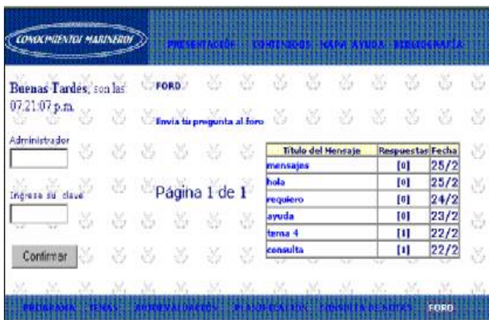
Figura 5. Interfaz diseñada para implementar el foro.

Como herramienta de comunicación asincrónica, además del correo electrónico se implementó un Foro . El alumno podrá escribir su inquietud accediendo a la opción Envía tu pregunta al foro (Fig.5), donde deberá especificar la dirección de correo, previa escritura del mensaje. La respuesta a una pregunta se realizará mediante la elección del mensaje a contestar.