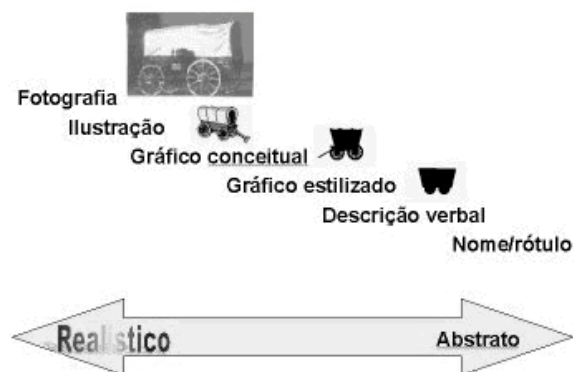
Figura 1: Grau de realismo dos elementos gráficos

* Uso de imagens e gráficos. Numa sociedade onde interesses poderosos empregam dados visuais para persuadir (o que Alvin Toffler chamou de "info-tatics") os educadores devem ser capazes de empregar imagens e multimídia nos ambientes de ensino-aprendizagem que constroem. Considerando que a geração atual quase não lê e que os jovens aprendem mais da metade do que sabem a partir de informação visual, percebe-se a importância de usar na comunicação elementos de imagem, animação e som. Com multimídia educativa pretende-se maior efetividade na aprendizagem motivando os alunos a devotar mais tempo e energia à atividade de aprendizagem. O projeto visual podem envolver elementos com maior ou menor grau de realismo, tal como ilustra a figura 1. Há estudos apontando que, sob certas circunstâncias, realismo pode interferir no processo de comunicação e aprendizagem e distrair, tal como mostrado na figura 2.