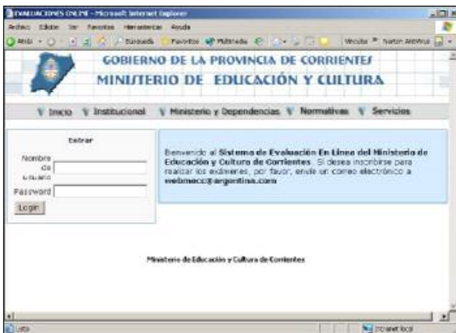
Figura 1. Interfaz inicial

Perfil Profesor. Los usuarios que pertenecen al perfil profesor son dados de alta por el administrador del sistema, quien otorga los permisos de administración para una determinada categoría de preguntas y un determinado grupo de usuarios. La figura 3 ilustra la interfaz para agregar nueva pregunta al examen.