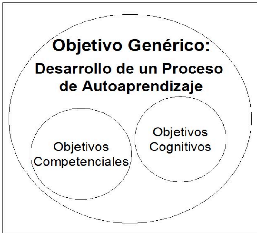
Figura 1. Esquema de los objetivos de la asignatura de “Energías Renovables”