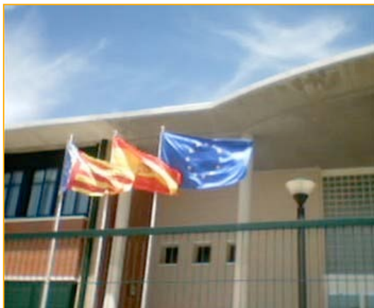
Vistes de l'institut FENTINA de Guadassuar Ribera)