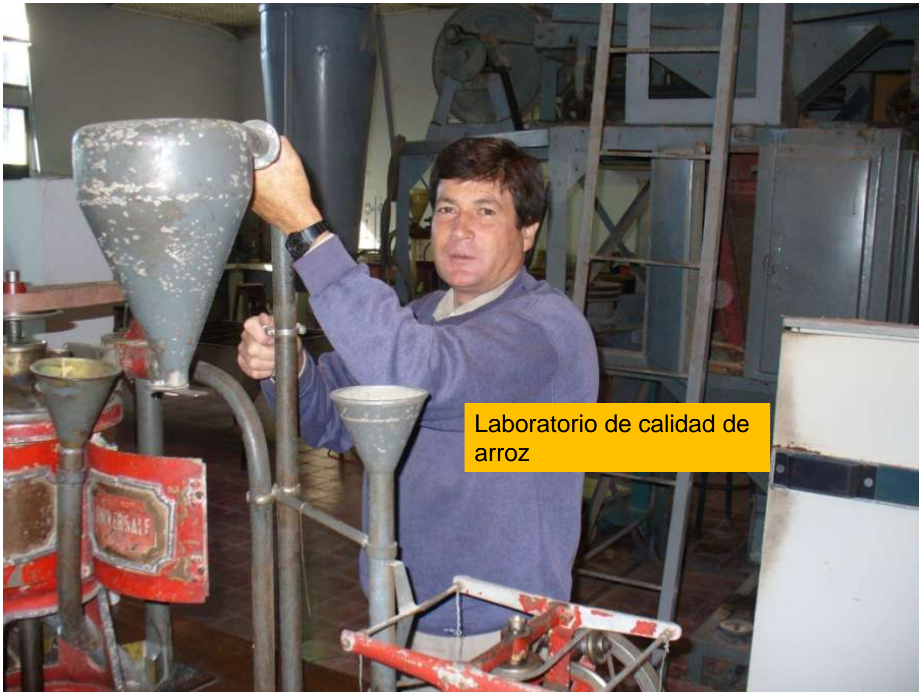
Laboratorio de calidad de arroz