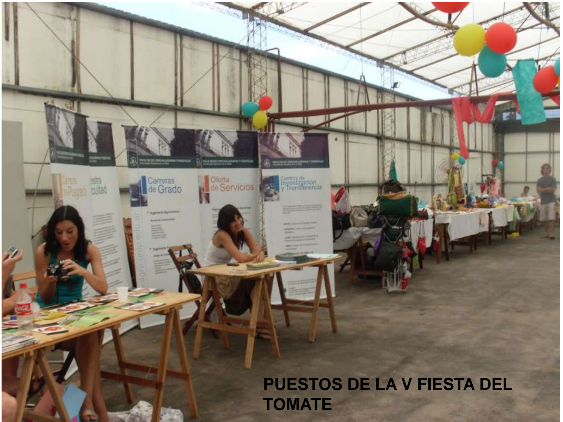
PUESTOS DE LA V FIESTA DEL TOMATE