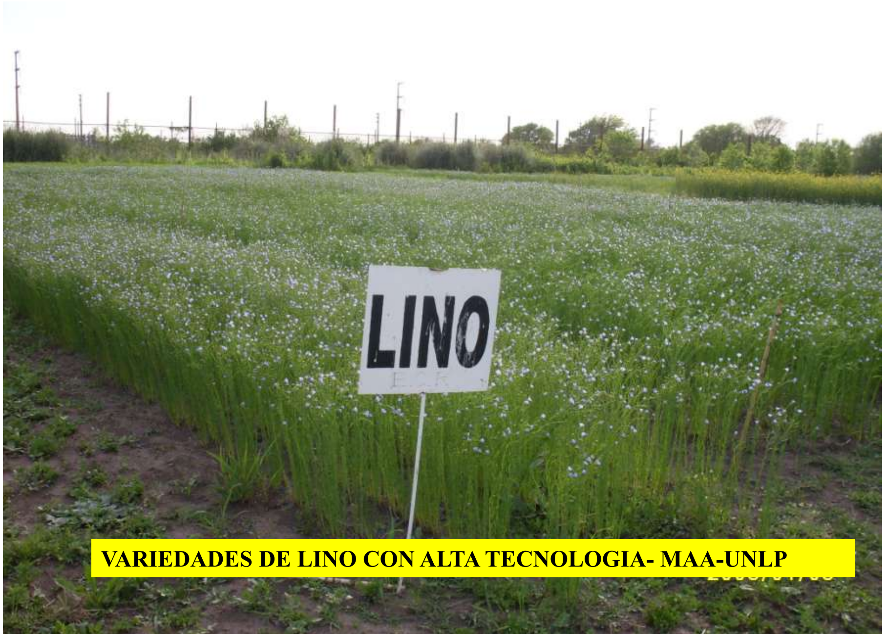
VARIETADES DE LINO CON ALTA TECNOLOGIA- MAA-UNLP