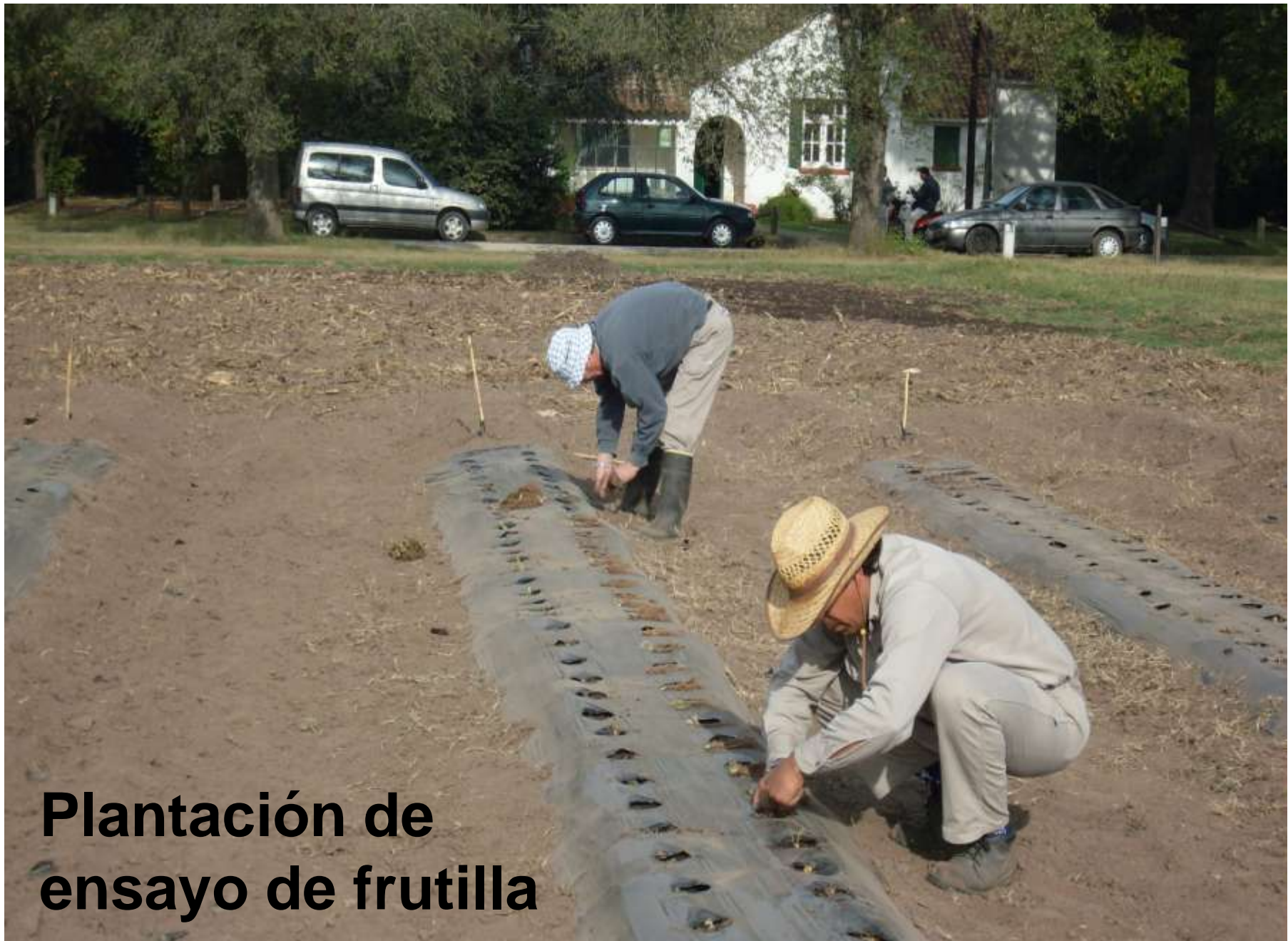
Plantación de ensayo de frutilla