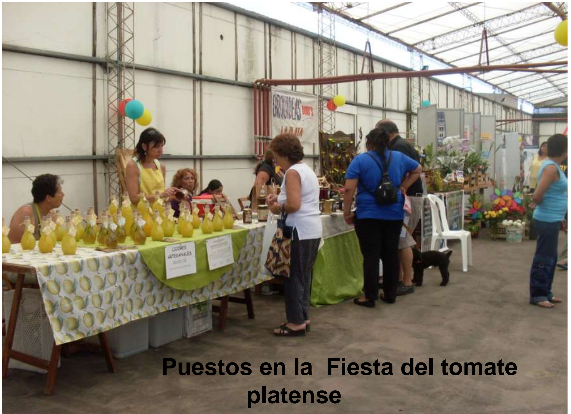
Puestos en la Fiesta del tomate platense