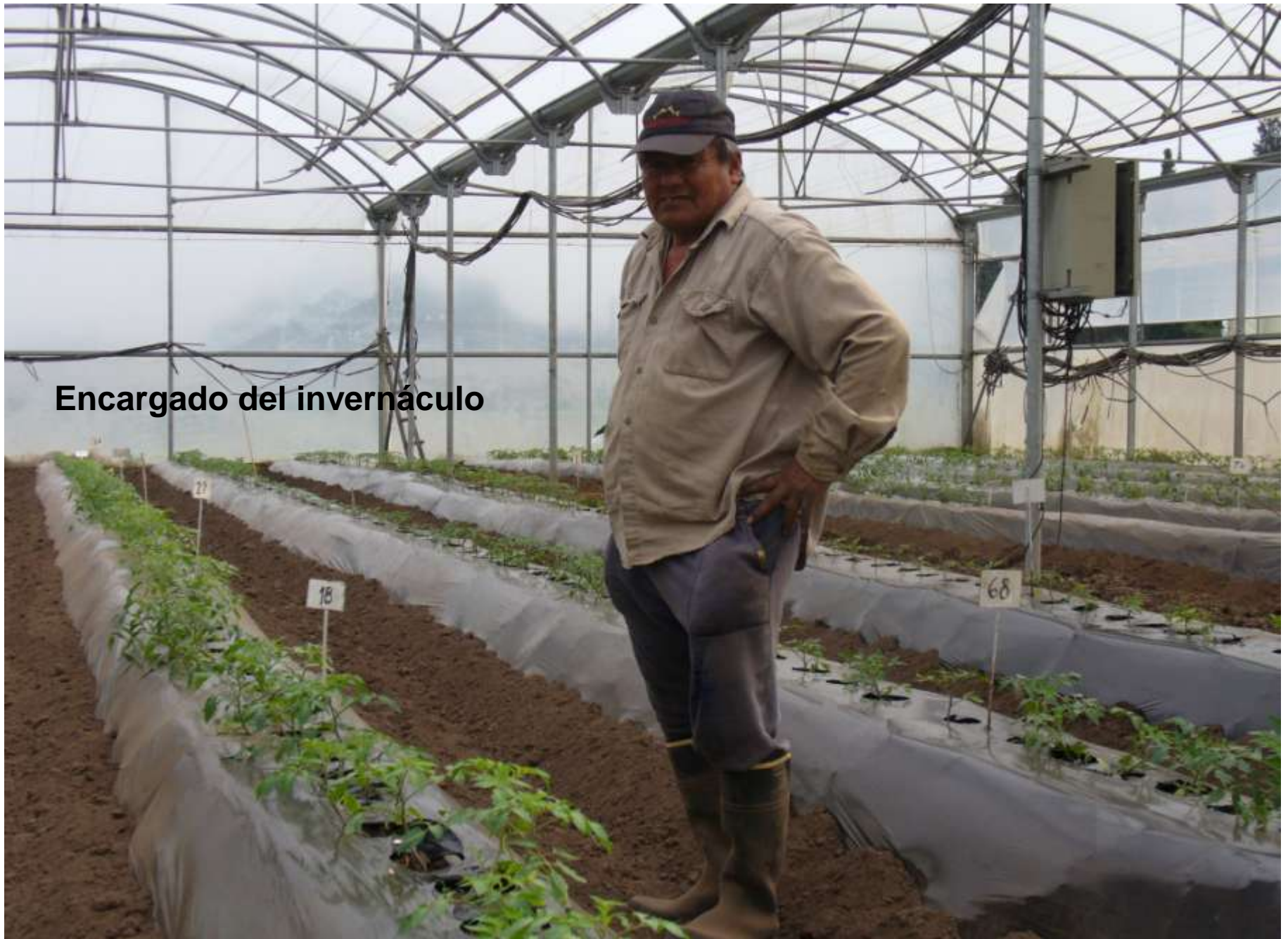
Encargado del invernáculo