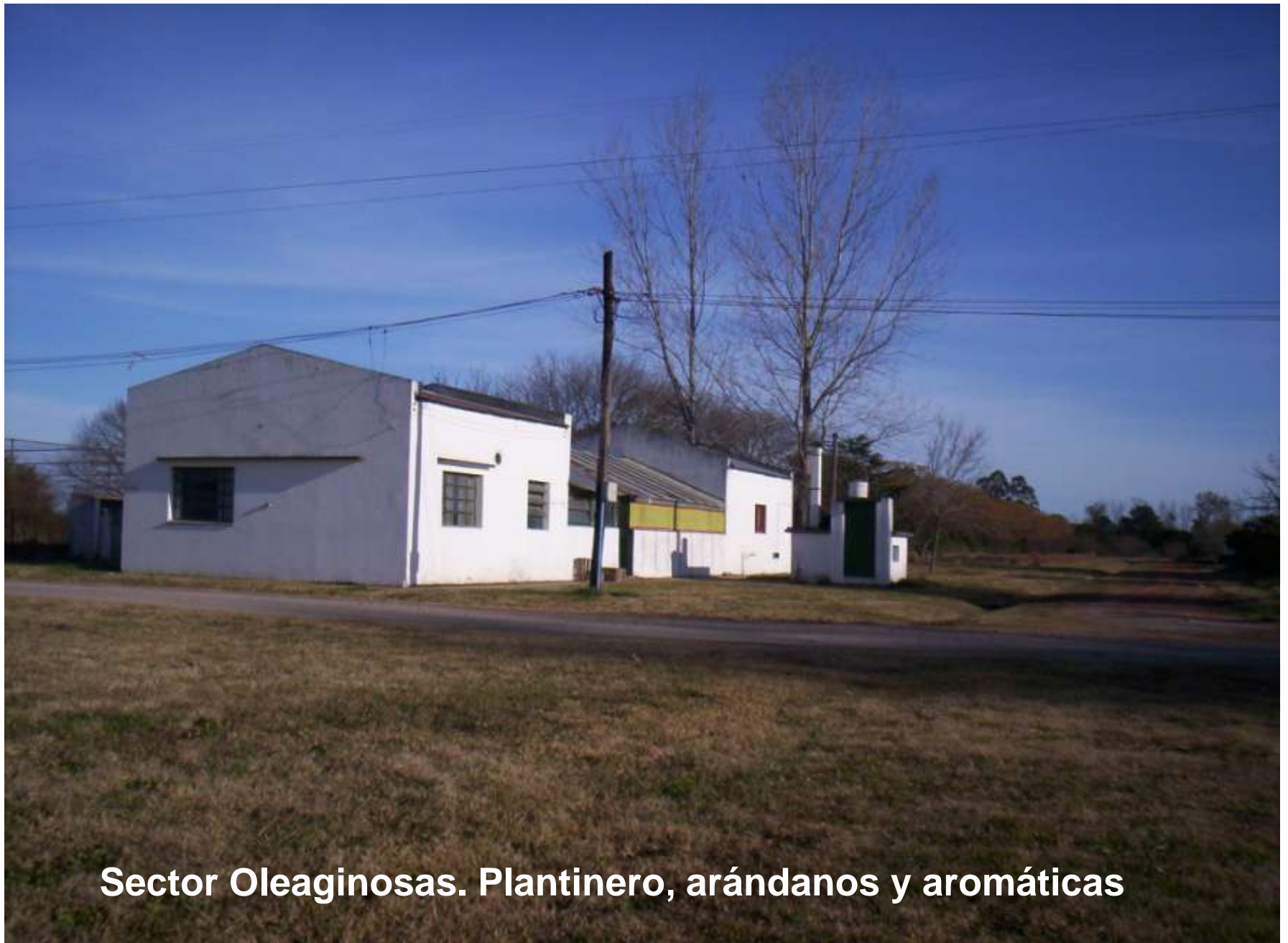
Sector Oleaginosas. Plantinero, arándanos y aromáticas