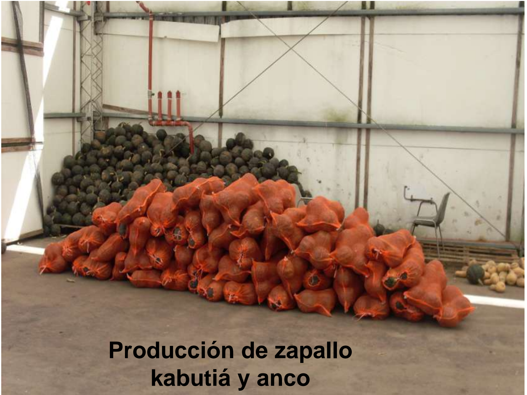
Producción de zapallo kabutiá y anco