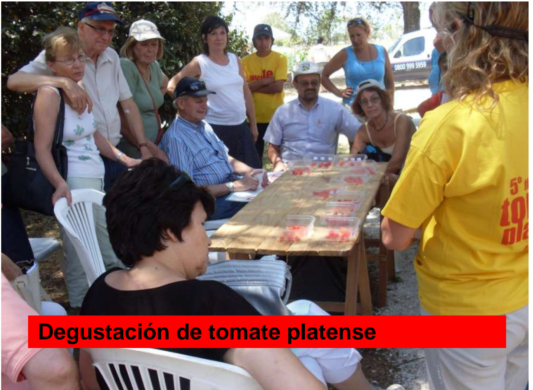
Degustación de tomate platense