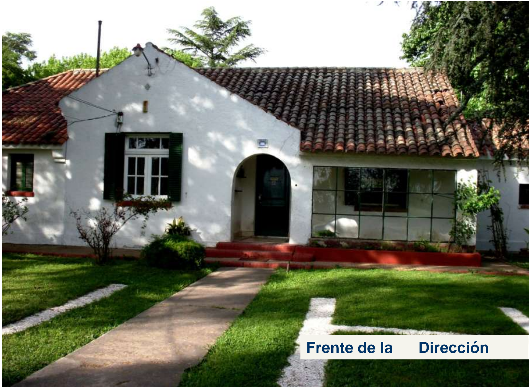
Frente de la Dirección