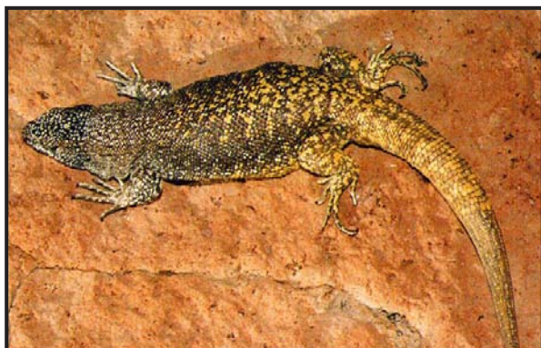
Figura 2. Ejemplar de Liolaemus flavipiceus proveniente de Laguna del Maule, Chile.