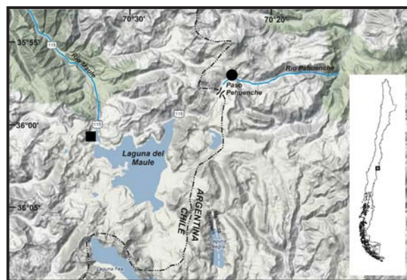
Figura 1. Distribución de Liolaemus flavipiceus en Argentina y Chile. Círculo negro: Paso Pehuenche (localidad tipo). Cuadrado negro: Laguna del Maule.

Se analizó una muestra de 16 ejemplares provenientes de los alrededores del embalse Laguna del Maule, Comuna de San Clemente, Provincia de Talca, VII Región del Maule, aproximadamente 2150 m (36°00'42,8"S; 70°33'24,2"W; Datum WGS84, Fig. 1). Nueve individuos (dos machos y siete hembras) fueron capturados a principios de marzo de 2008 en zonas rocosas adyacentes a la laguna, aguas abajo del pretil del embalse. Esta muestra se complementó con dos individuos (un macho y una hembra), obtenidos en febrero de 2012 aguas arriba del pretil. El diseño y color en vida fueron registrados mediante fotografía digital. Los ejemplares fueron sacrificados por inyección intraperitoneal de lidocaína al 1% (Solin®),