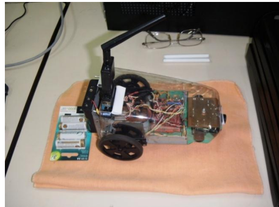
Fig.1 Prototipo inicial con tracción diferencial y un arreglo de cinco sonares y conexión bluetooth

La metodología utilizada en el presente trabajo consistió en un análisis preliminar de la manera en que interactúan con el entorno los diversos tipos de sensores tanto de percepción interna como de percepción externa. Se recopiló información bibliográfica relevante al estudio y datos de trabajos anteriores. Se obtuvieron los lineamientos de la situación actual y se seleccionaron los sensores de percepción interna complementarios, necesarios para la navegación propuesta. Se procedió al modelado del sistema en estudio, se implementó el sistema multisensorial. Se reprogramó el motor de inferencias del sistema experto basado en reglas. Se hicieron pruebas de navegación.