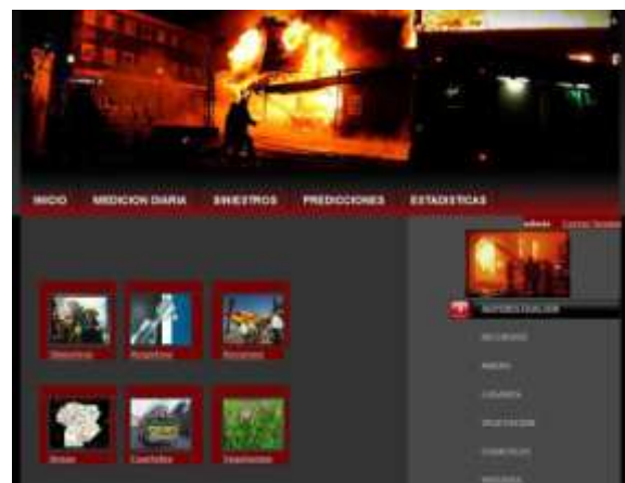
Figura 1: Pantalla de acceso Sitio Web

Inicialmente en el proyecto se presuponía la existencia de registros de incendios recolectados en las estaciones de bomberos, o en estaciones meteorológicas. Sin embargo, se descubrió que no se llevaba a cabo ningún tipo de registro de incendios y que era necesario un sistema que permitiera capturar al menos los siguientes datos: fecha del siniestro, coordenadas de ocurrencia del siniestro, temperatura, humedad, presión, velocidad del viento y cantidad de hectáreas afectadas. A raíz de ello, se diseñó un sistema para realizar la carga de mediciones meteorológicas y de siniestros (incendios) en el que se puedan registrar a través de una interfaz WEB esta información.