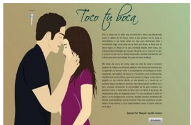
Figura 3. Pantalla con el texto “Toco tu boca”

Tema: Otoño medieval. Autor: Rata Blanca. Género: Rock neoclásico. Tempo: Adagio. BPM: negra 75. Duración: 02:35 minutos (en un período de 10 minutos se escucha 4 veces)