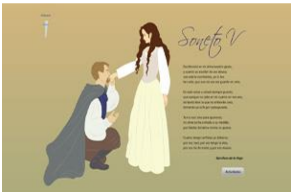
Figura 2. Pantalla con el “Soneto V”

Tema: Angelito vuela. Autor: Don Omar. Género: Reggaetón. Tempo: Andante. BPM: negra 80. Duración: 01:40 minutos (en un período de 10 minutos se escucha 7 veces)