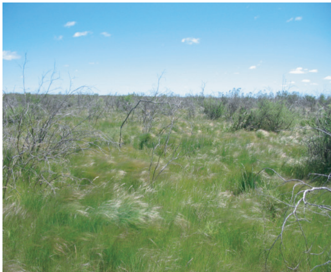
Vista panorámica de un pastizal natural en el sudoeste bonaerense.

arbustal» o al «dominio del pajonal» . Estos son estados degradados desde el punto de vista ecológico y socioeconómico.